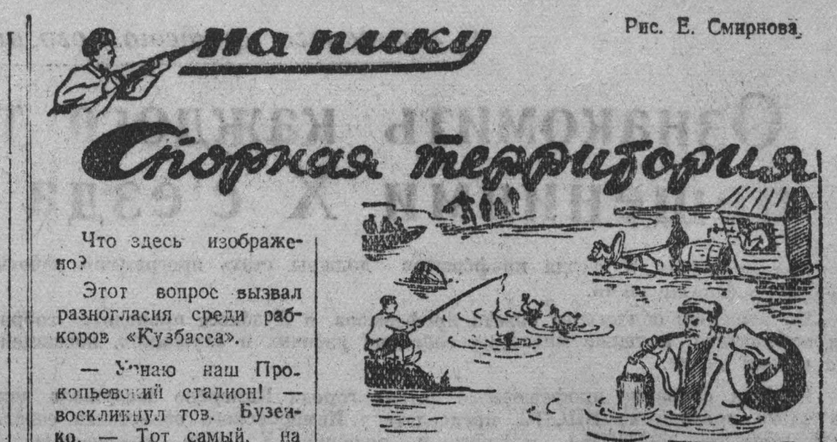
Рис. Е. Смирнова. Что здесь изображено? Этот вопрос вызвал разногласия среди работников «Кузбасса».