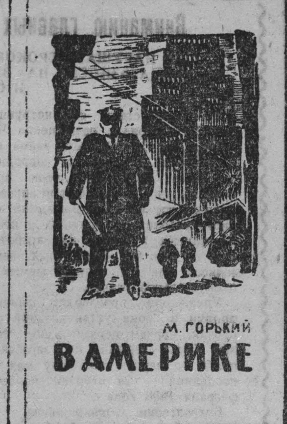
М. ГОРЬКИЙ В АМЕРИКЕ

В такого рода «деятельности» американских делцов, изображенных Горьким, нетрудно увидеть прообраз современной кониски по расследованию «антиамериканской деятельности». Великий русский писатель подверг уничтожающему осмеянию