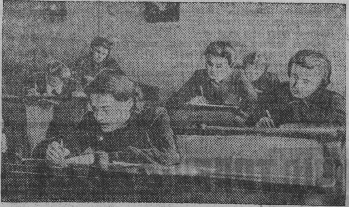
Начались экзамены. Ученицы 10 класса 41 школы г. Кемерово пишут письменную работу по литературе.