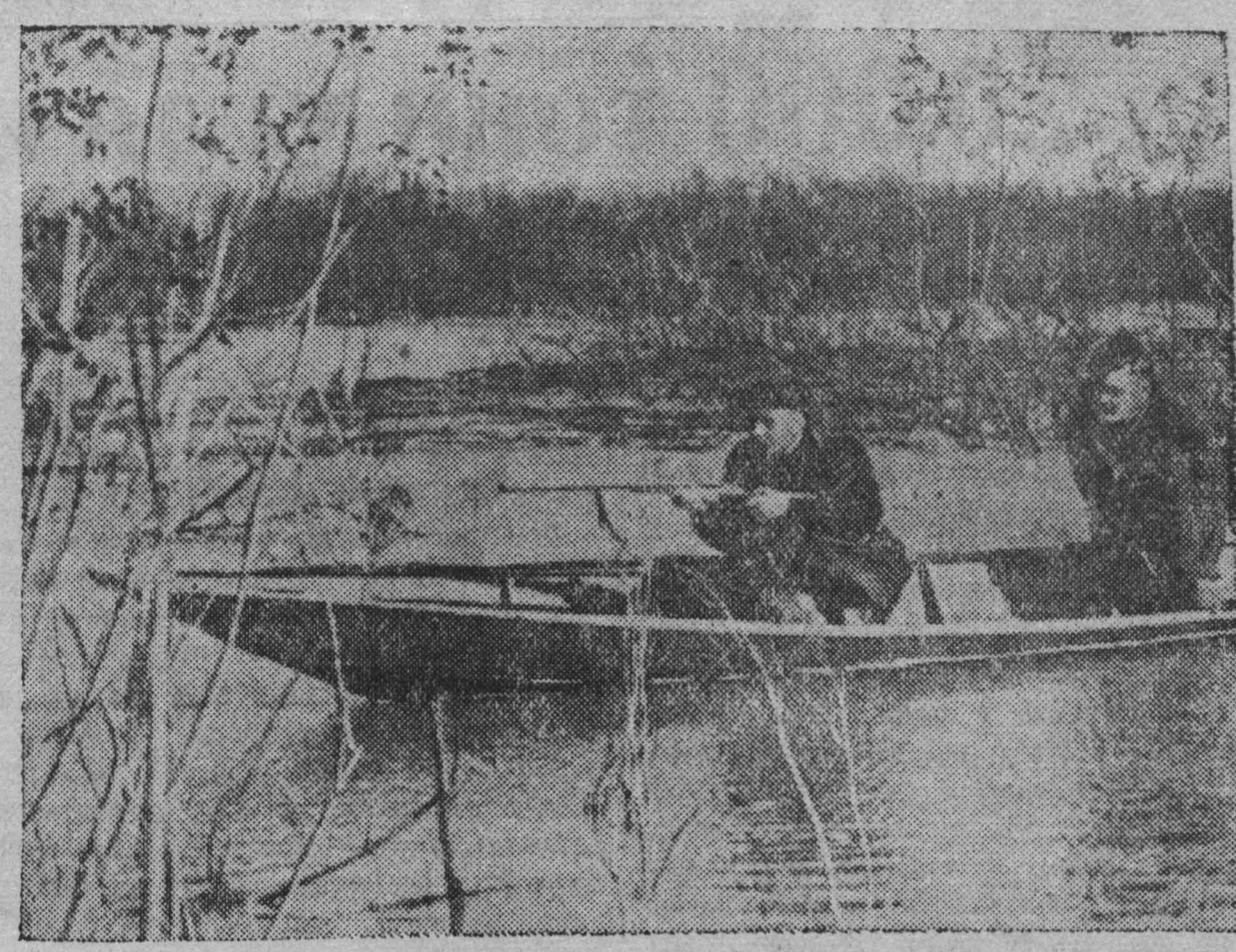
На весенней охоте.