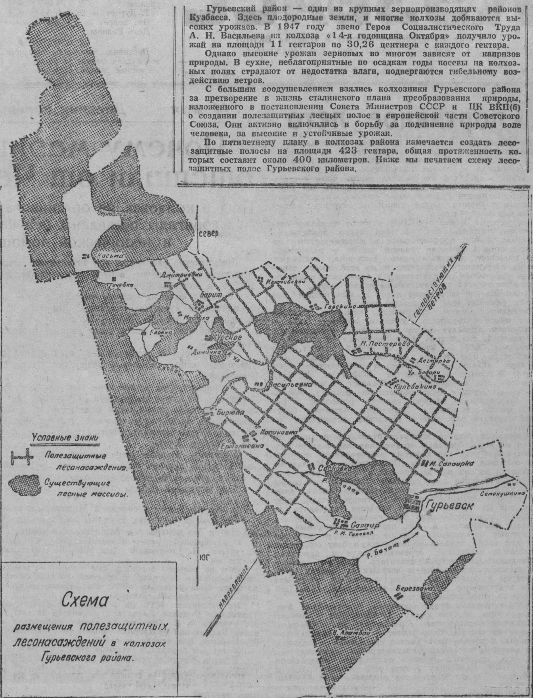
Схема размещения лесозащитных полос в колхозах Гурьевского района.