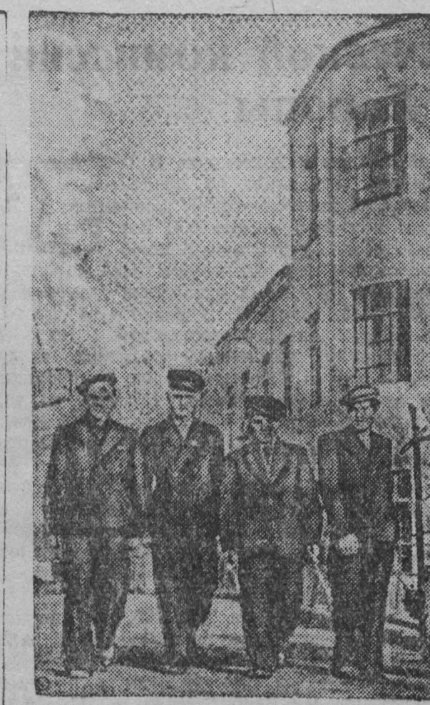
Комсомольско-молодежная бригада шахты «Черная гора» первая перешла на график пилковой работы. Бригада выполняет задание на 150—180 проц.

Наша бригада стремится довести ежемесячную добычу до 20 тысяч тонн, но шахтоуправление не оказывает нам в этом помощи. В смену по плану нам требуется 43 вагона порожняка, но угля в печах у нас постоянно имеется гораздо больше. Реко, когда у нас забират весь уголь. Если нам ежемесячно будут подавать порожняк по потребности, значит бригада сумеет ежедневно давать 750—800 тонн угля.