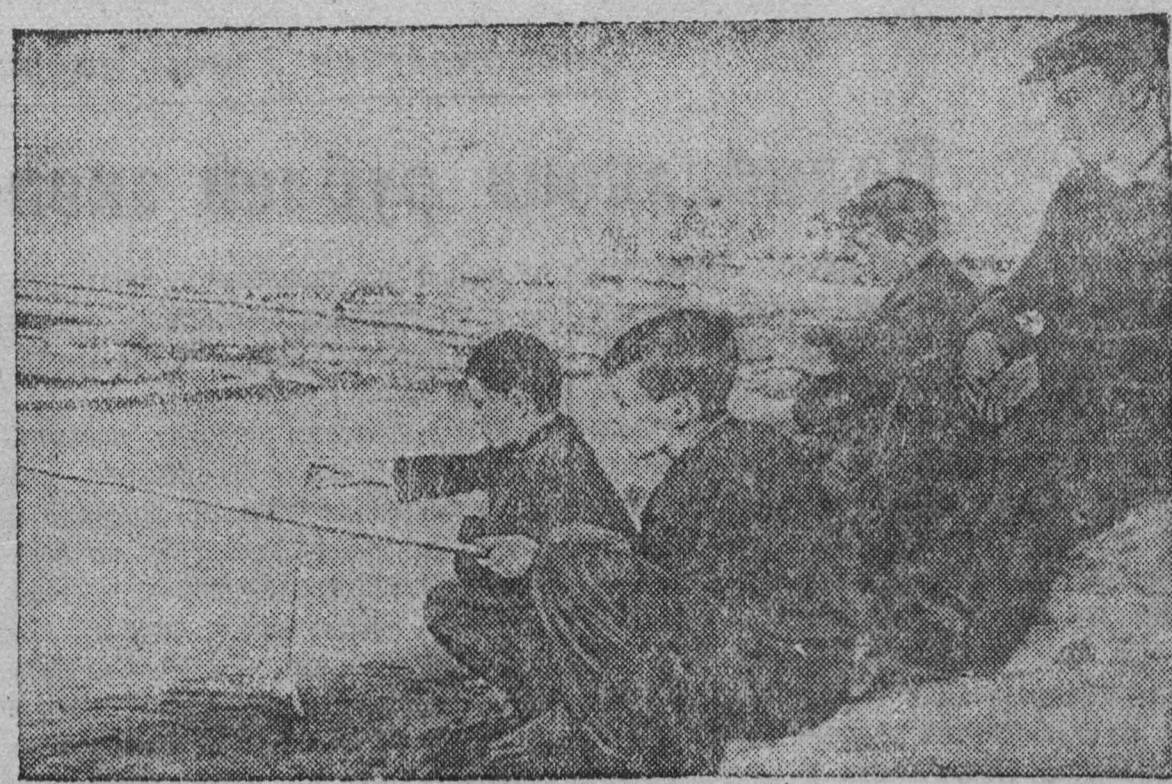
Юные рыбаки.

В Мельбурне группа хулиганов сорвала регулярный воскресный митинг Австралийской коммунистической партии. Хулиганы избili одного оратора и угрожали другим. Полиция не призвала арестов участников этой провокации.