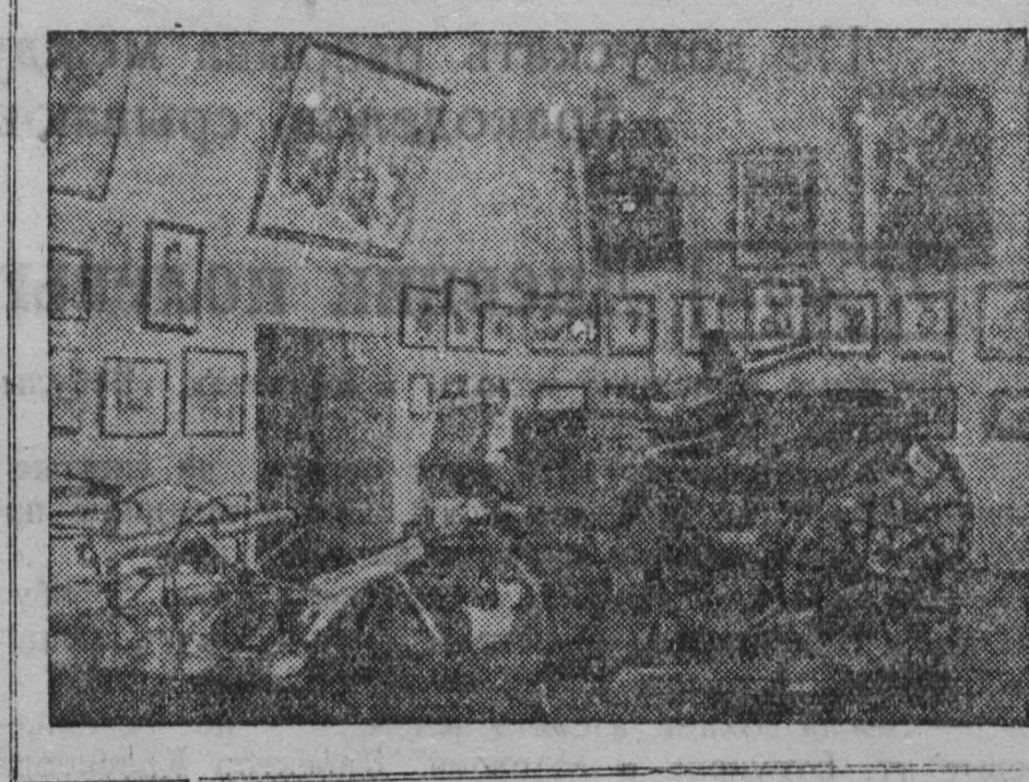
13 миллионов человек побывали в залах Музея Революции за 25 лет его существования. Советский народ гордится Музеем Революции. Это музей той истории, которая создается сейчас руками советских людей. На снимке: зал Гражданской войны 1918—1920 гг.

Делами, кровью, строкою вот эту, нигде не бывшее в найме, — а саваало взвитое красной ракетой Октябрьское, руганное и пропетое, пробитое пулями знамя!