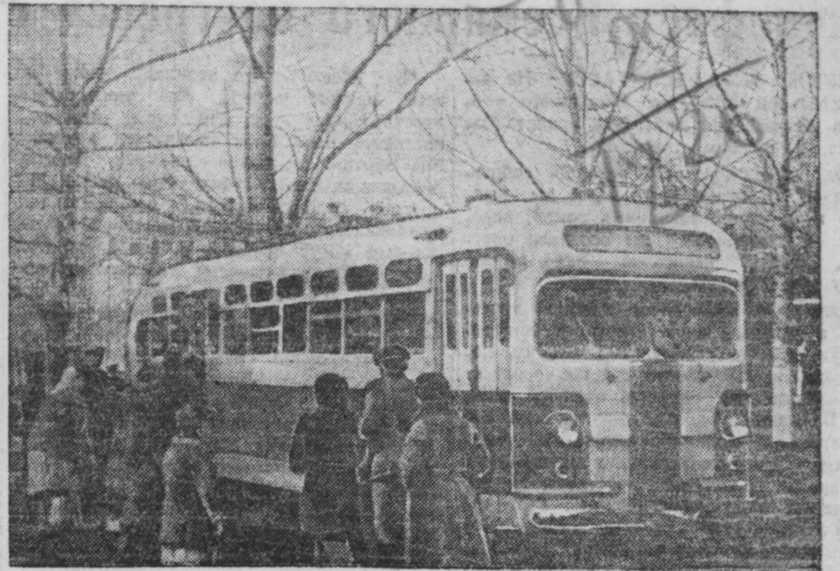
Между гор. Сталинском и шахтерским пригородом Байдаевка курсируют комфортабельные пассажирские машины.