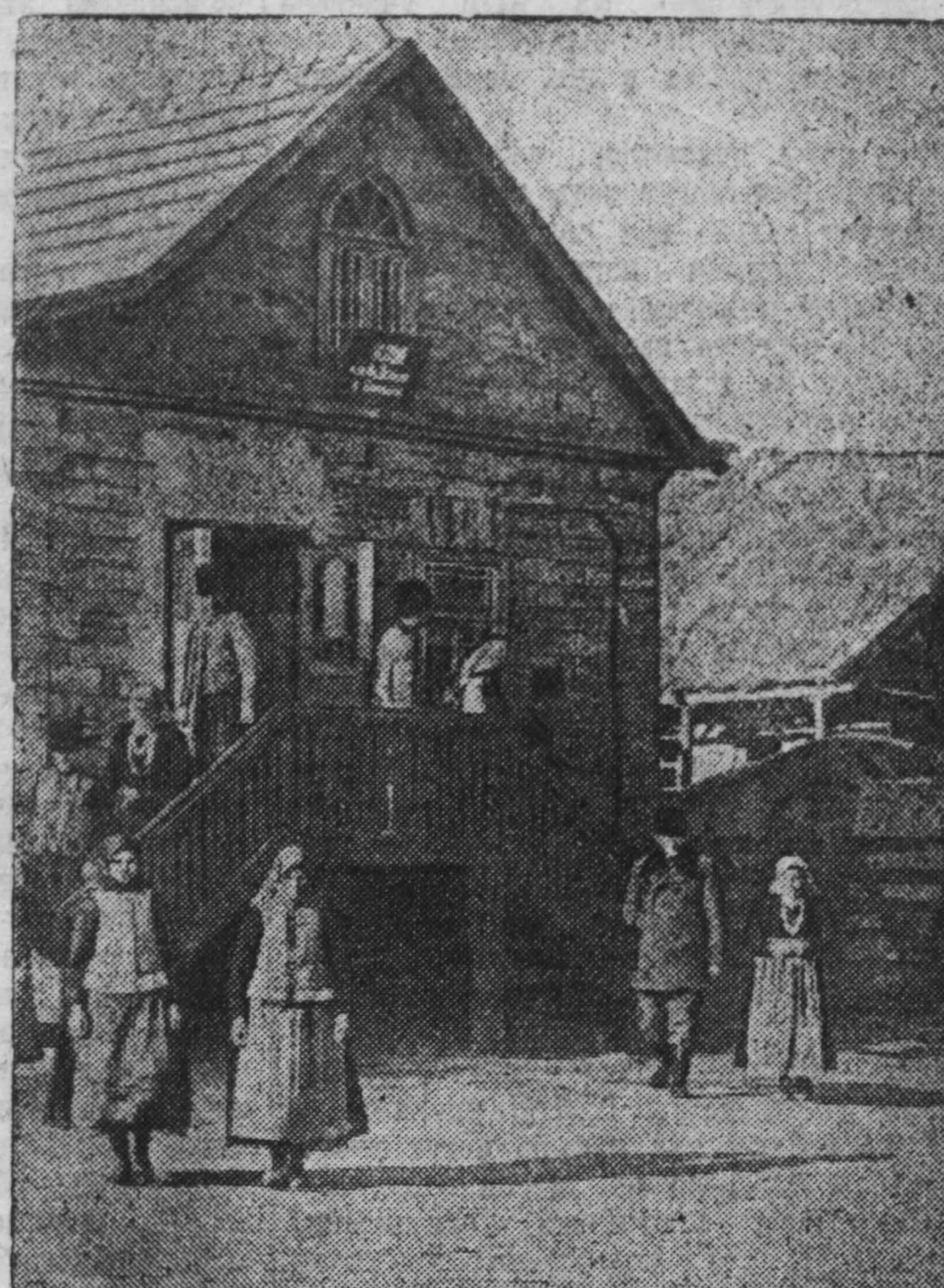
Молдавская ССР. В 1946 году в республике началось массовое строительство сельских клубов, домов культуры и изб-читален. За два года в селах Молдавии построено 1339 культурно-просветительных учреждений. На снимке: клуб колхоза имени Ленина в селе Твалдица Чадыр-Лунгского района.