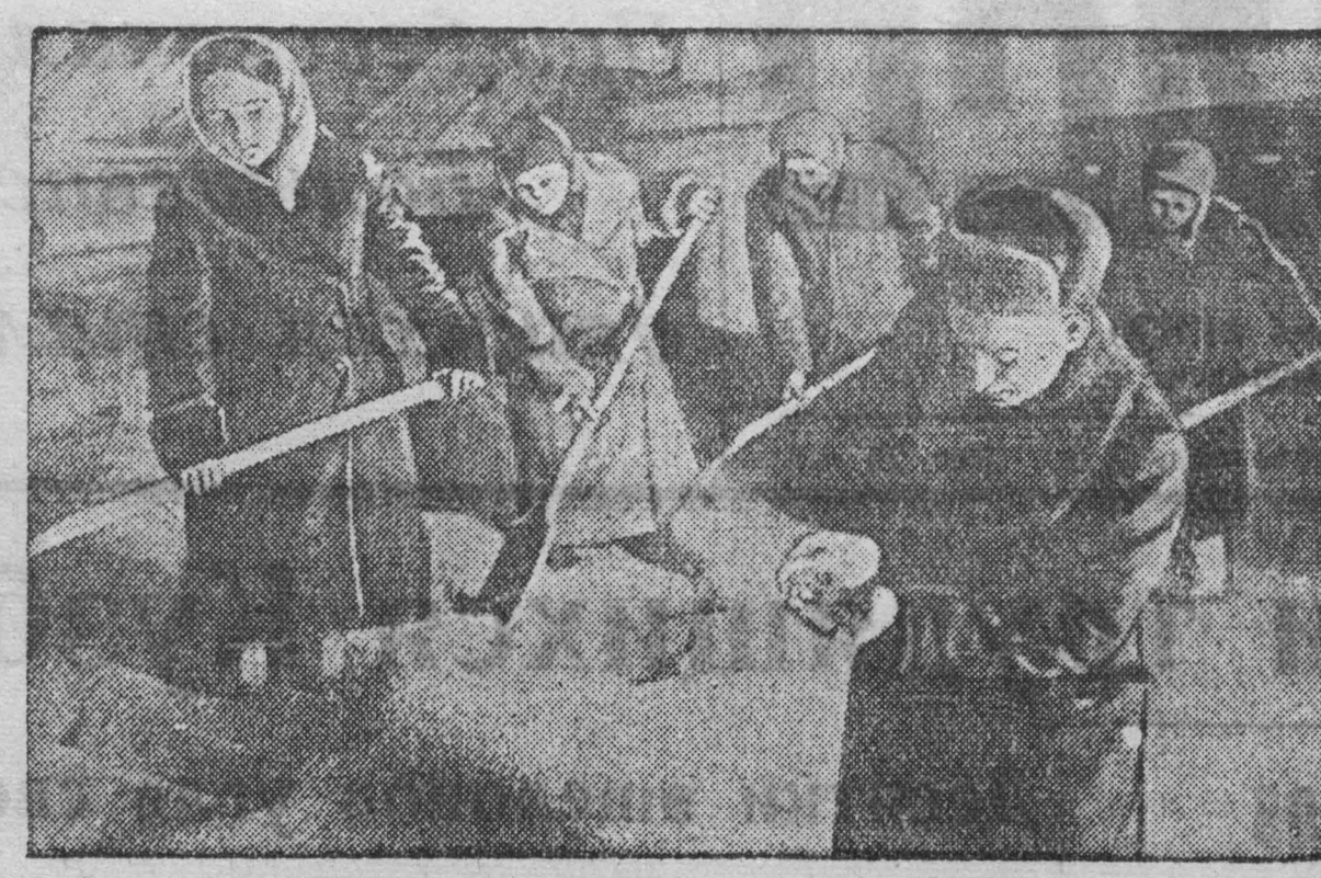
В колхозах Кузбасса идет деятельная подготовка к весеннему севу. На снимке: колхозники сельскохозяйственной артели «Ударник полей» Промышленовского района переопашивают семенное зерно.

Задача партийных организаций — усилить партийное руководство социалистическим соревнованием.