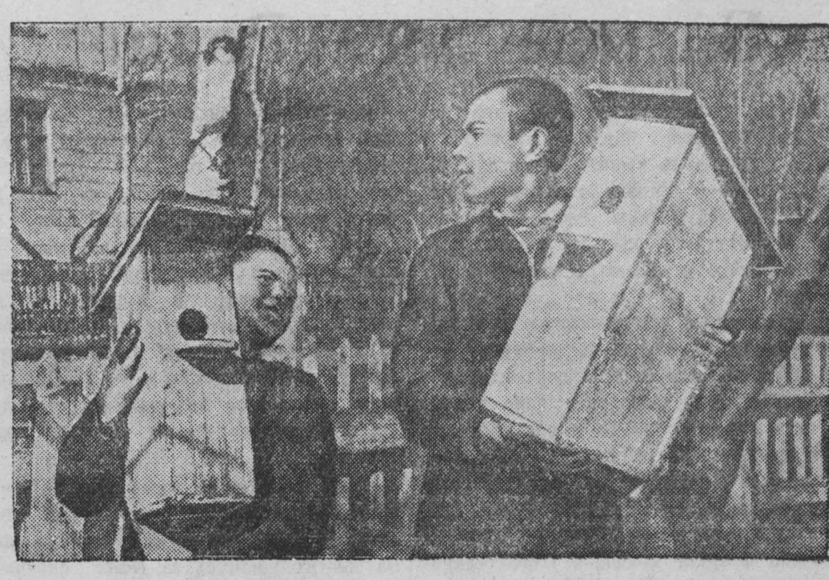
Восна в Прокопьевске.

На этом рассмотрение повестки дня Генеральной Ассамблеи было закончено.