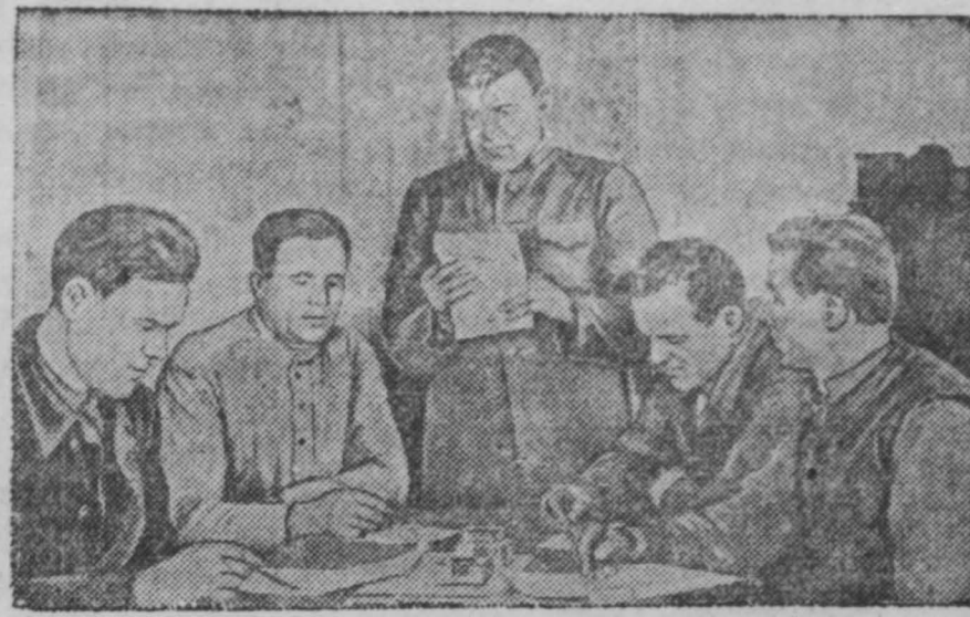
Механизаторы сельского хозяйства Кузбасса включают, сев в соревнование за высокую культуру земледелия.

За здравствует великий вождь и учитель советского народа товарищ Сталин!