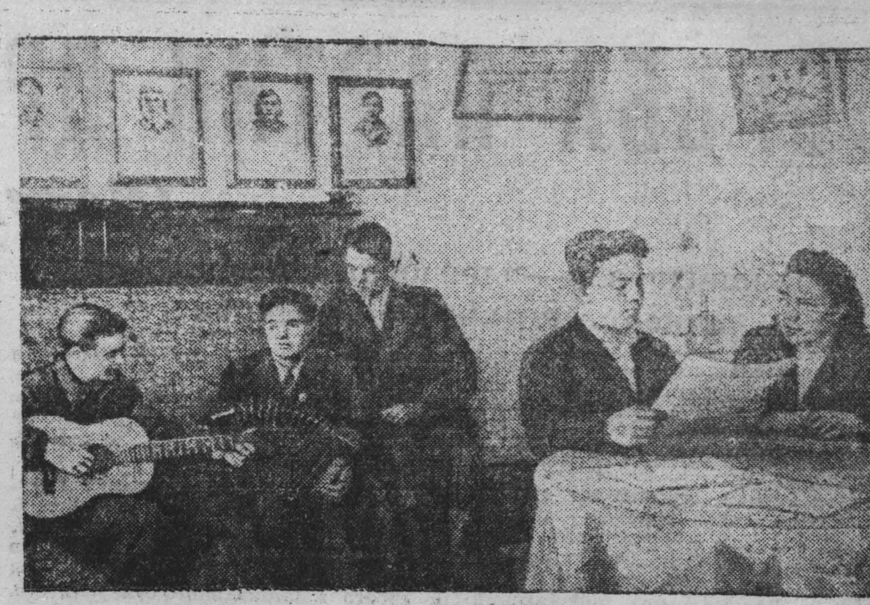
На шахте «Центральная» треста «Кемеровоуголь» вновь острожно общаются для молодых рабочих, окончивших школы ФЗО. При общении имеется буфет с горячими обедами и холодными завтраками. Силами женщин-общественниц создан уют в комнатах, хорошо оборудован красный уголок. На снимке: молодые рабочие в часы отдыха.