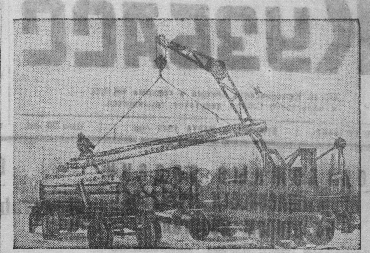
Терсинский леспрохоз треста «Кемеровостройлес». На снимке: погрузка леса на автомашину автокраном.