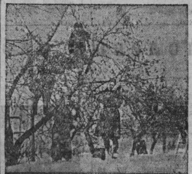
На снимке: сбор семян работниками «Зеленострой» с американского клевера для посева в питомниках гор. Кемерово.