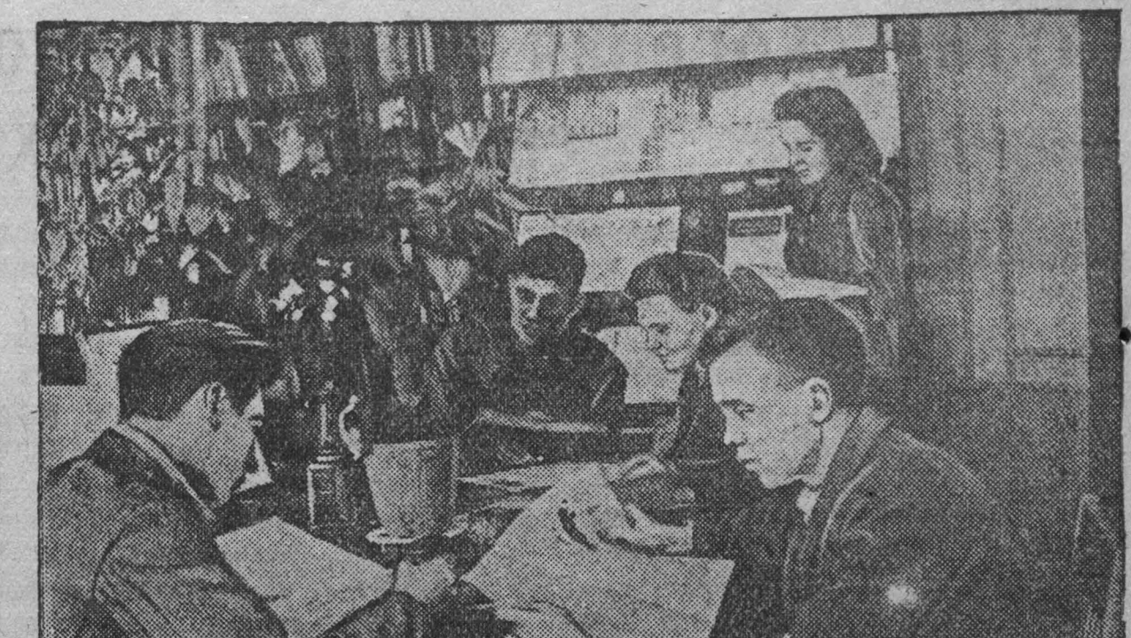
Г. Сталин. При Деме техники Кузнецкого металлургического комбината работает библиотека стажеров. Сюда приходят лучшие стажеры завода подобрать необходимую литературу. На снимке: в читальном зале библиотеки.

ночного дежурство — 1-21; отделение: партийного и пропаганды — 8-63; редактора — 4-85; отв секретаря — 2-53; судьящихся — 11-52; прием информации