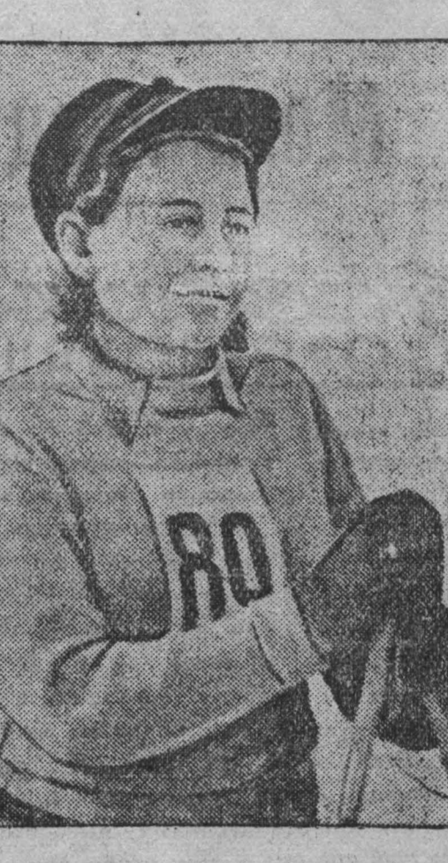
Лыжник.