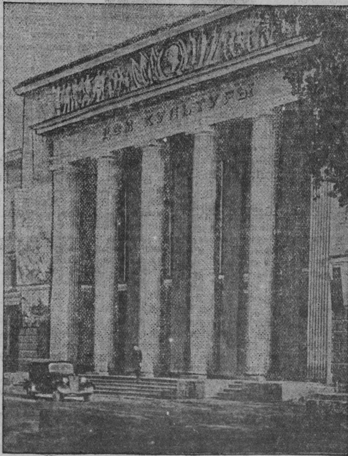
Дом культуры в Кировском районе города Кемерово.

На шахте «Журинка» молодые навалотбойщики, только что пришедшие из школы ФЗО, имеют большие заработки. Они отправили своим родным в Тамбовскую область десятки посылок с подарками. Многие уже купили хорошие костюмы.