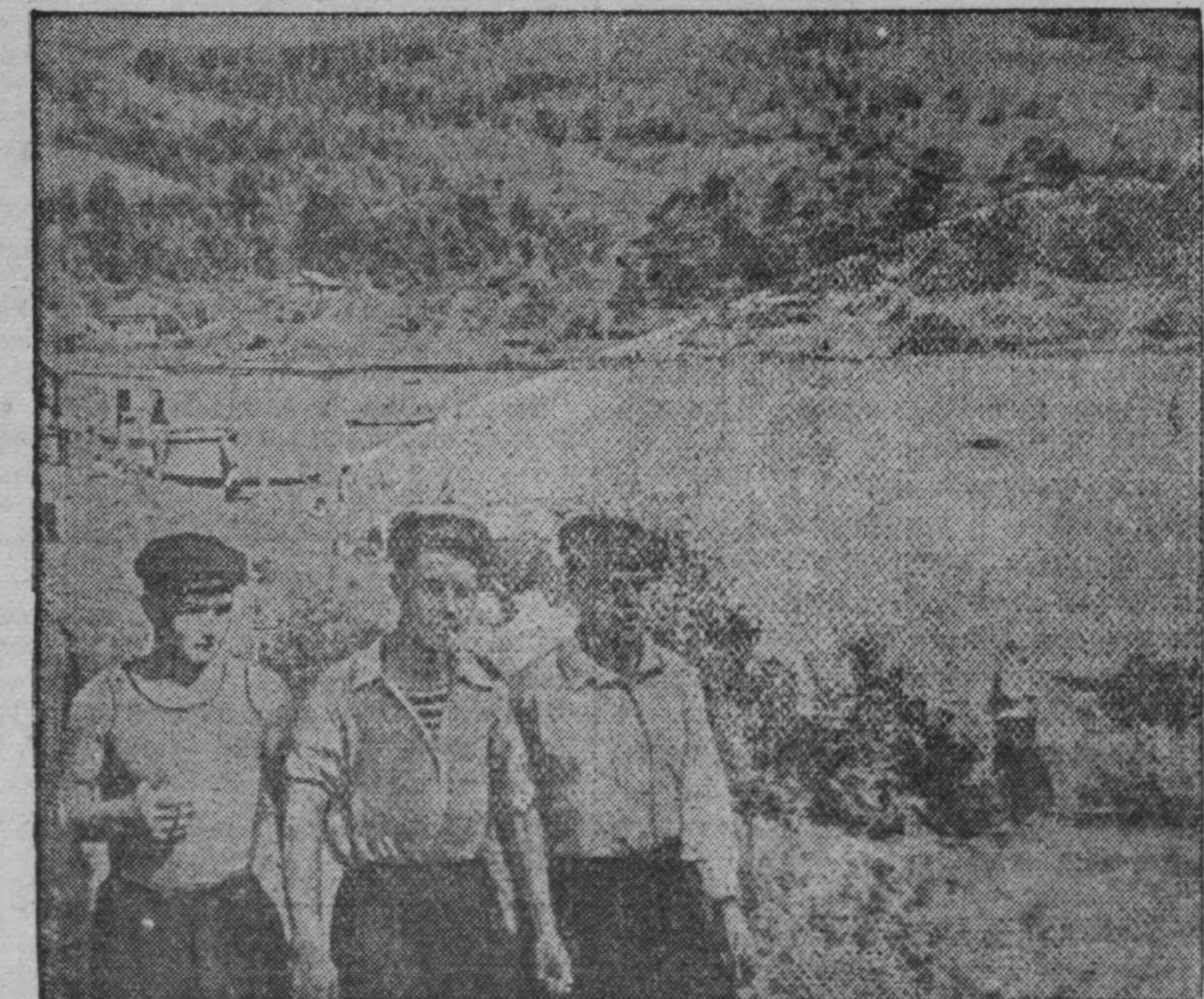
Любимое место отдыха шахтерской молодежи Прокопьевска — Зенковский парк.