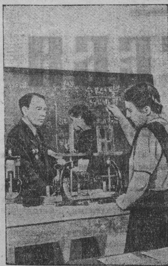
Г. Кемерово. На классных занят...