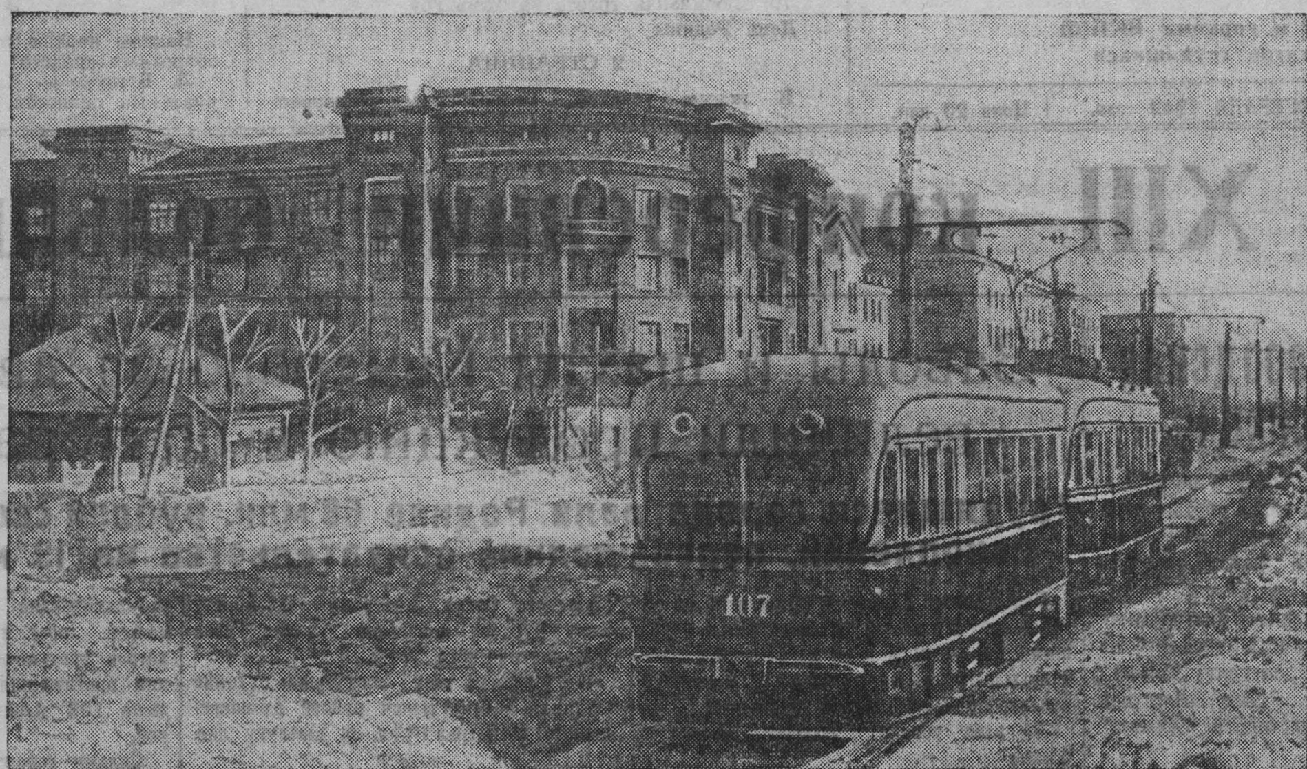
С каждым годом неизменно изменяется облик нашего города — областного центра Кузбасса. По улице Советской выросли новые корпуса жилых домов замечательной архитектуры. Пошли новые, удобными вагонами. И лишь маленькая деревянная изба, доживающая свой век, напоминает о том времени, когда Кемерово был захолустной сибирской деревушкой.

Это указание великого Сталина мы ложим в основу всей дальнейшей деятельности районной партийной организации.