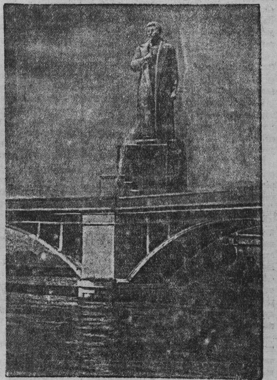
Строительство Невинномысского канала, начатое по заданию товарища Сталина, закончено. В нем принимали участие десятки тысяч колхозников. Население многих сел и станиц Ставрополья, веками испытывавшее нехватку из-за бедствия, получит хорошую кубанскую воду. На снимке: скульптура товарища Сталина на Невинномысском канале.