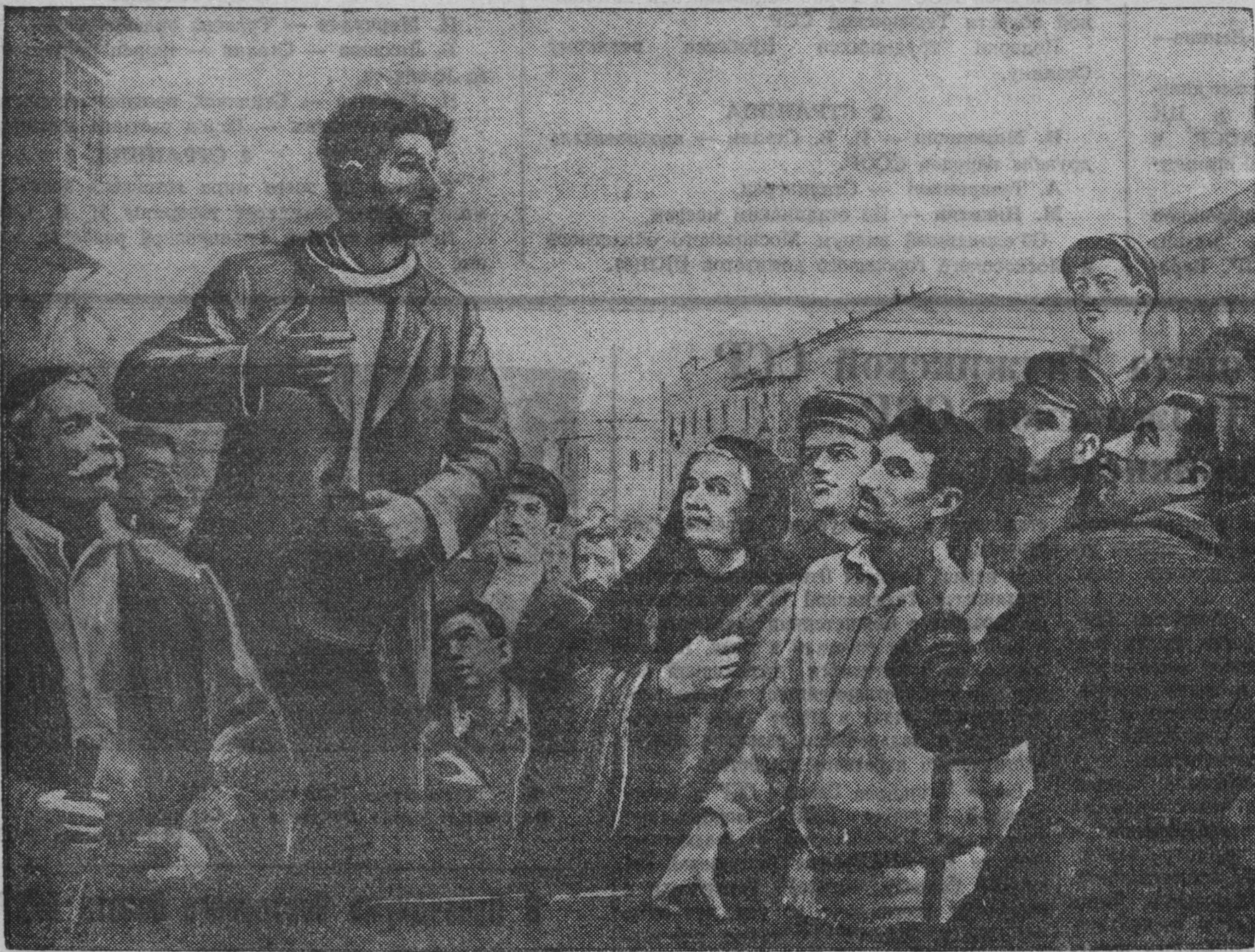
«Выступление И. В. Сталина на рабочем собрании в Тбилиси».