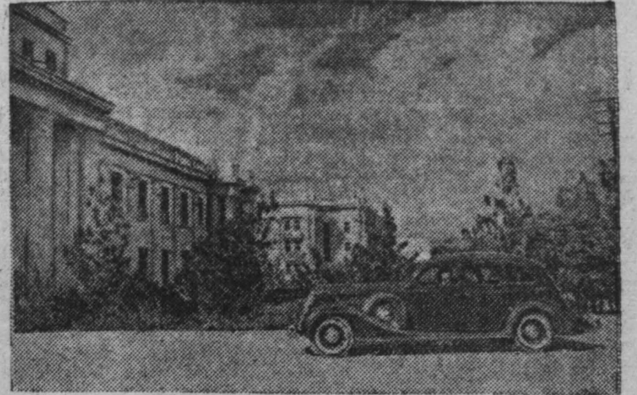
К двадцатилетию Таджикской ССР. На снимке: улица Лахути в г. Сталинбаде.