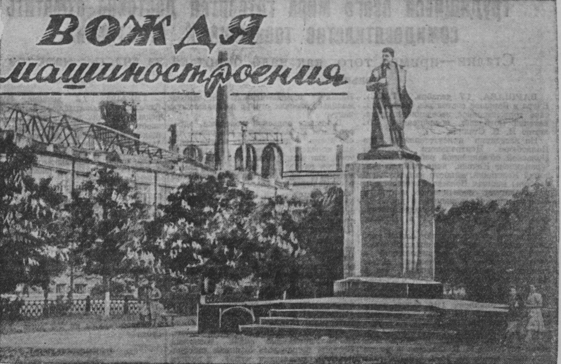
В ОЖДАЯ машиностроения