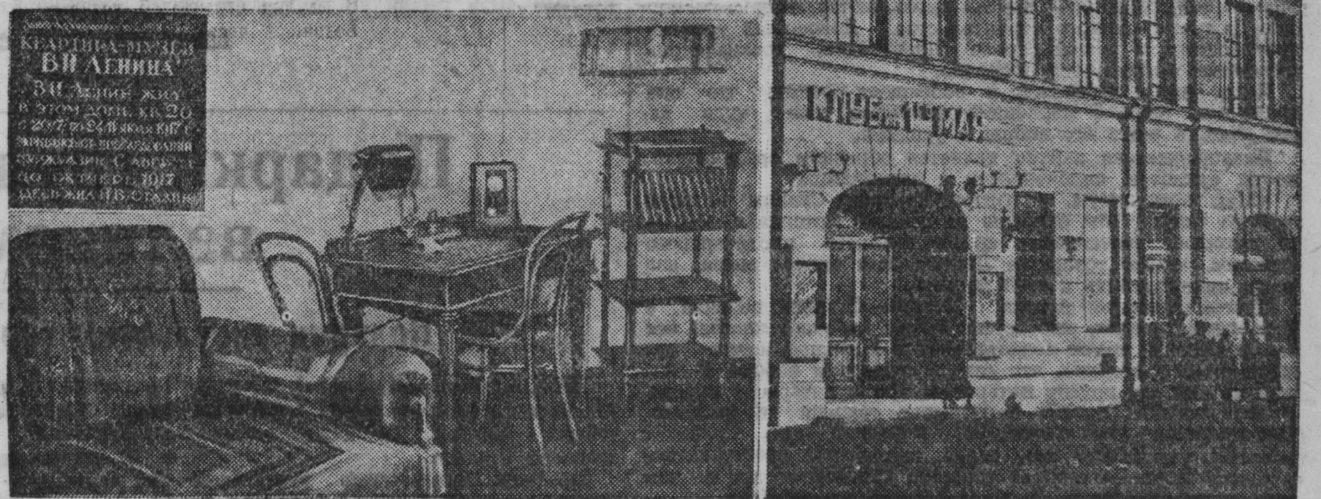
На снимках: слева — квартира С. Я. Аллилуева в Ленинграде; здесь летом и осенью 1917 г. жили В. И. Ленин и И. В. Сталин. Справа — Ленинград, проспект Карла Маркса, 37. Здесь 8 августа 1917 года открылся VI съезд партии большевиков. Работой съезда руководил товарищ Сталин.