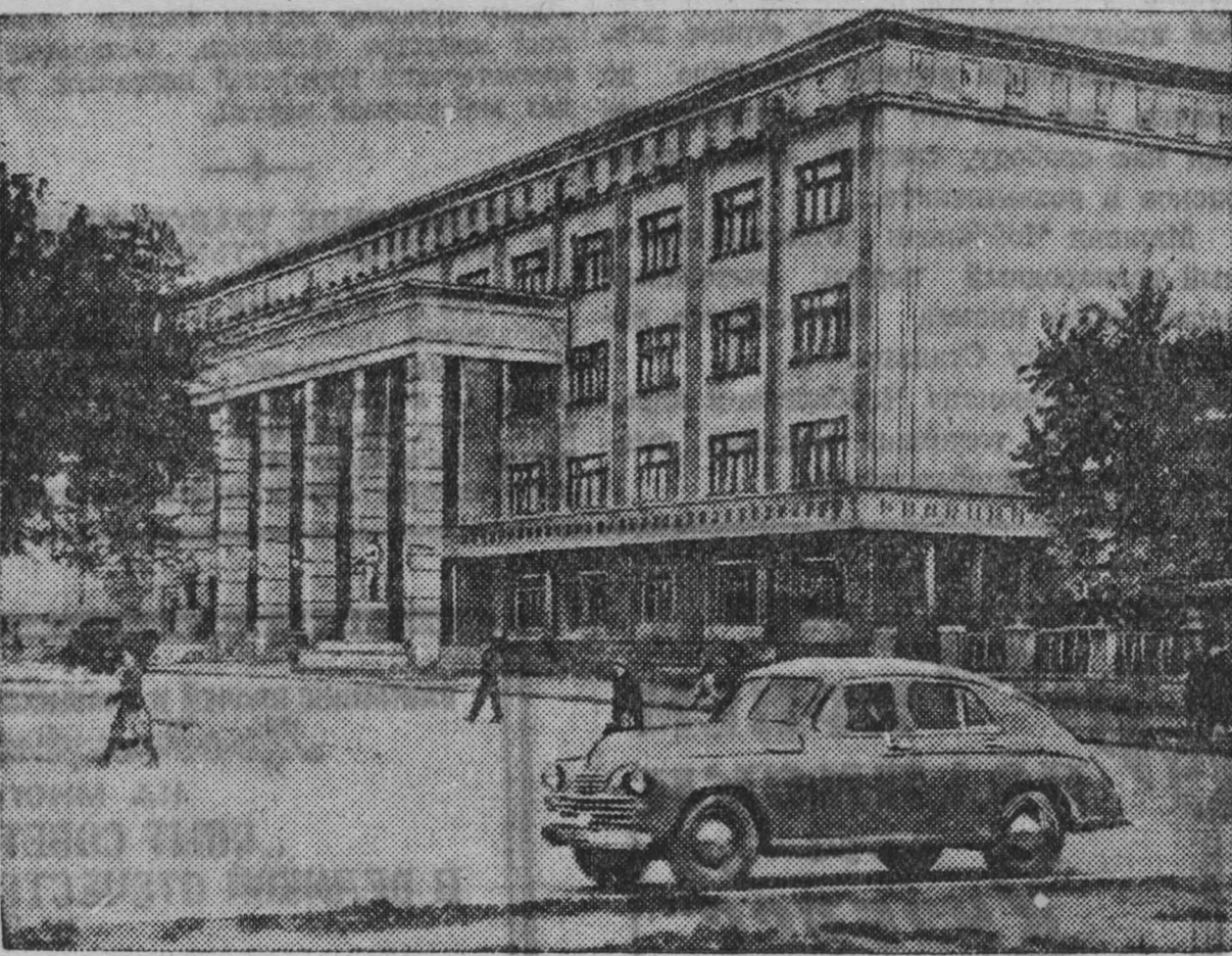
г. Сталинка. У Дворца культуры кузнецких металлургов.

Накануне Великой Отечественной войны город Сталинка был уже вполне сложившимся крупным промышленным городом Кузбасса. В годы войны город Сталинка, как и весь Кузбасс, продолжал расти и развиваться. Металлургический комбинат имени И. В. Сталина значи-