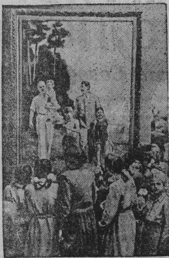
Бенгрия. На выставке советской живописи в Будапеште.