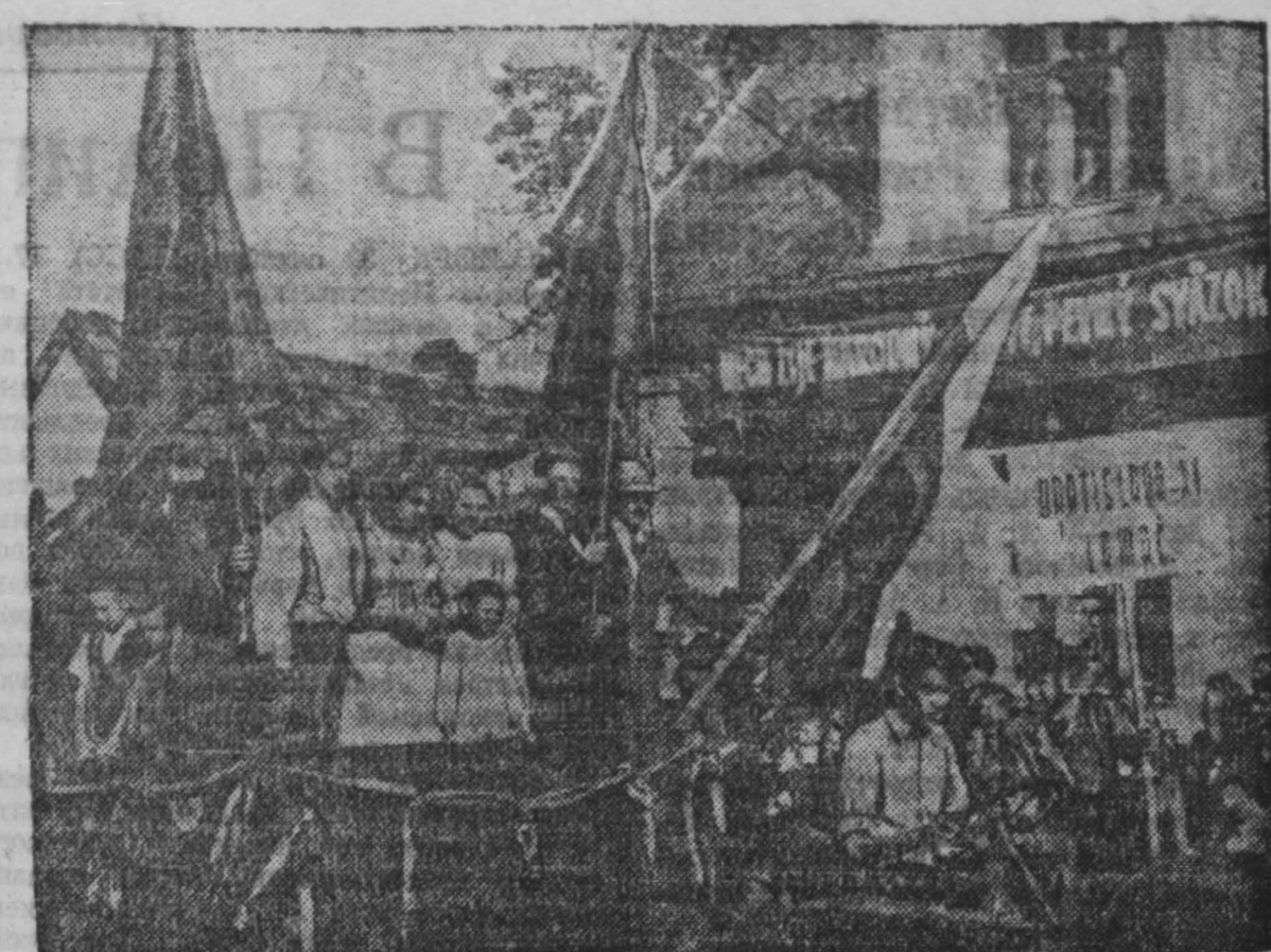
28 октября чехословацкий народ торжественно праздновал 31-ю годовщину провозглашения независимости Чехословацкой республики. На фабриках и заводах прошли митинги и собрания, посвященные национальному празднику.

Сейчас на шахте среднемесячная производительность каждой лавы — 7.100 тонн. Но наш коллектив считает, что из лавы № 1 нашего участка можно добыть до 9.000 тонн угля в месяц. За это мы и будем бороться.