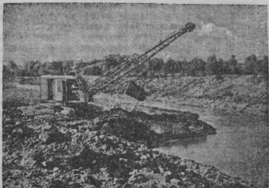
Эстонская ССР. Пайдская машинно-мелиоративная станция Яраамского уезда оснащена современными мощными машинами и орудиями. Она имеет 5 новых кураторезов, экскаваторы, бульдозеры, болотные плуги и др. На снимке: экскаватор, работающий на реке Пайде.