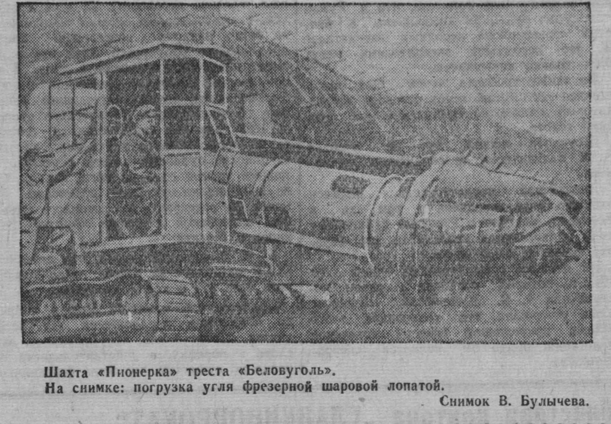
Шахта „Пионерка“ треста „Беловуголь“. На снимке: погрузка угля фрезерной шаровой лопатой.

высоты от основного штрека. Тов. Копкин обычно работает на проходке четырех печей. Если первая из них пройдена на 15 метров высоты, то следующая идет на уровне 10 метров, третья — еще на 5 метров ниже и четвертая — только засечается. Сменный цикл Копкин начинает с работы первой печи. Отбурив ее, он переходит на вторую и т. д. При такой организации работ первую, самую высокую, печь всегда успевают к концу смены проветривать от отпадных газов, и она оказывается готовой к началу цикла в следующей смене. Работая по своему методу, тов. Копкин добился максимальной уплотненности рабочего времени. Производительность труда у него на 50—60 процентов выше, чем у остальных нарезчиков.