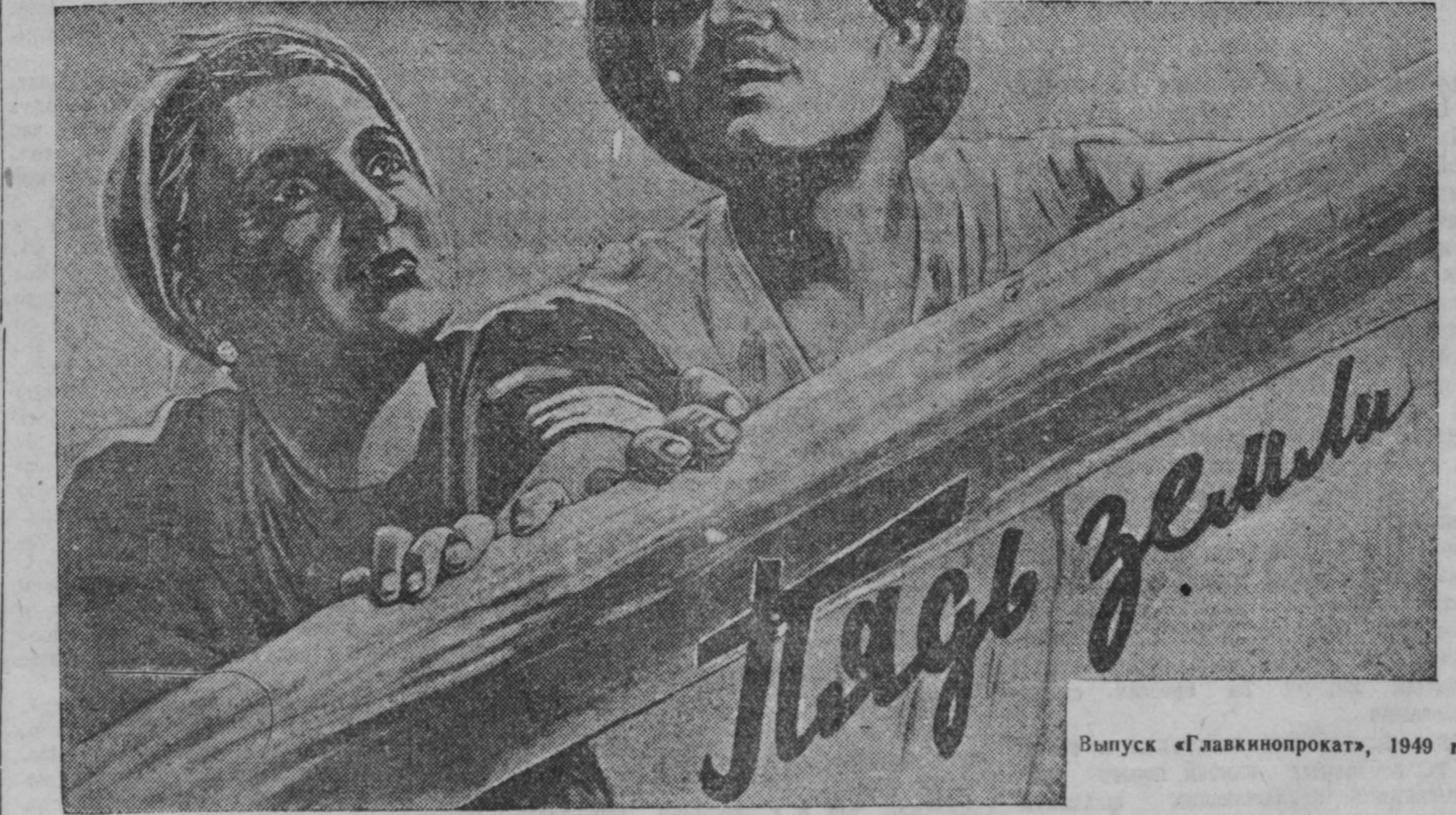
Выпуск «Главкинопрокат», 1949 г.