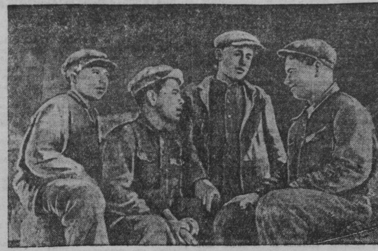
Комсомольско-молодежная бригада, успешно окончившая школу ФЗО, сейчас работает в строуправлении Анжеро-Судженска. Бригада выполняет норму ежемесячно до 175 процентов.