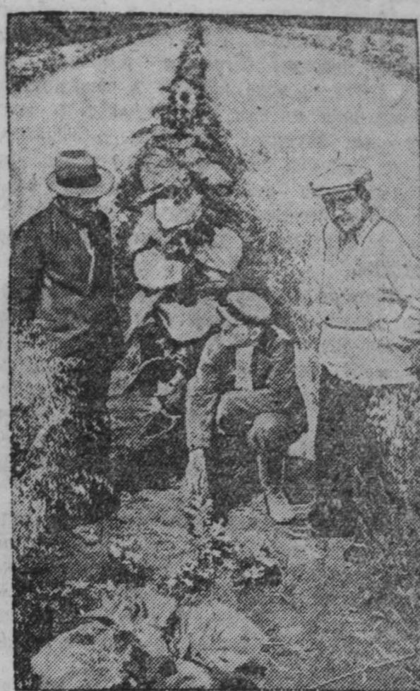
ВОРОНЕЖСКАЯ ОБЛАСТЬ. На полях научно-исследовательского института земледелия центральным черноморским полем имени В. В. Докучаева наиболее полно освоена система агрономических мероприятий на ученик вилейских русских агрономов Докучаева, Костычева и Вильямса.