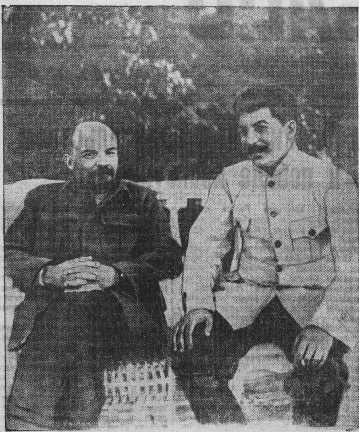
В. И. Ленин и И. В. Сталин в Горьком. (1922 г.)

Стоит это здание в центре Москвы, на площади, носившей крылатое имя Революции. На краснокаменном фронтоне его — граничные буквы: «Музей В. И. Ленина».