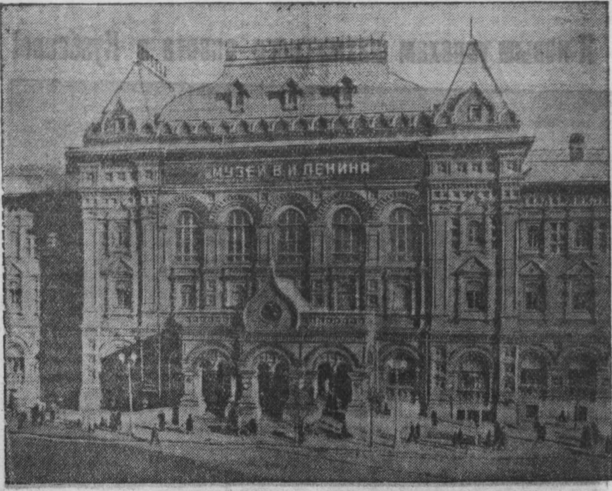
Центральный музей В. И. Ленина в Москве. Со дня основания музея — с 15 мая 1936 года его посетило свыше 8 миллионов человек.