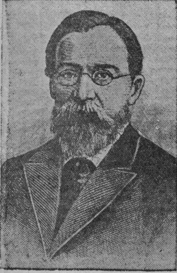
А. Г. Столетов

(К 110-летию со дня рождения) Александр Григорьевич Столетов (1839—1896) — знаменитый ученый-физик, видный прогрессивный деятель второй половины XIX века.