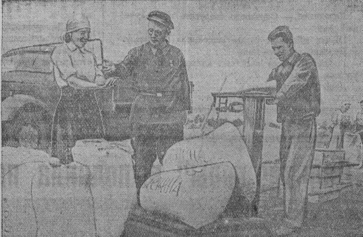
Краснодарский край. Колхозники собирают богатый урожай. В колхозе началось выдача натурального аванса колхозникам в счет выработанных трудовых.