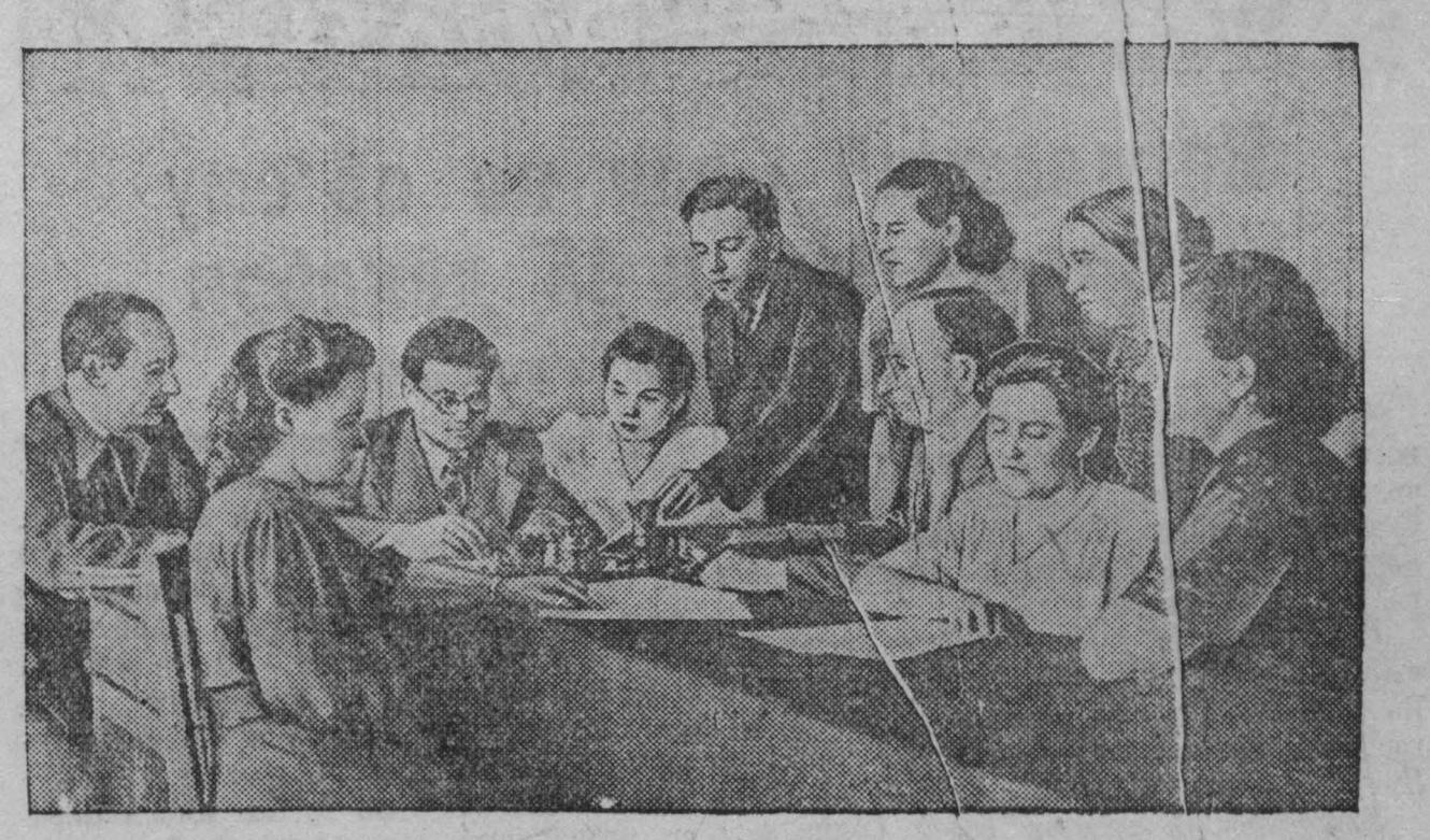
Пребывание делегации медицинских работников Сталинской области в Кемерово. На снимке: врачи Донбасса и Кузбасса обсуждают пункты договора на соревнование. Снимок И. Иванова.

Газета «Унитас» пишет в переловой статье, что в отношениях между Тито и американцами нет никакой нужды в посредничестве, потому что сегодня знон доллар торит закон в Югославской столице.