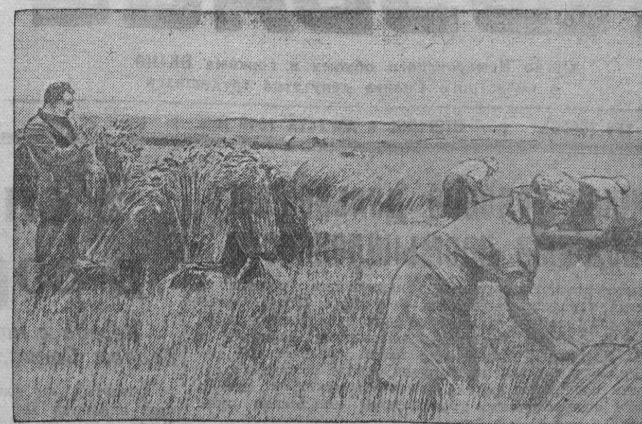
На уборке урожая в колхозе «Ударник полей» Промышленного района.

Вчера с промышленных предприятий и учреждений Центрального района города Кемерово вышла первая колонна автомашин на вывозку хлеба нового урожая. Все автомашинщики прошли специальную проверку автоинспекцией. Подобраны лучшие водители. Хорошо и организованно провели подбор автомашин в «Кемеровомашстрой» (начальник тов. Крамов). Это предприятие выслало вчера 12 автомашин, вылив полностью задание райкома ВКП(б). Автоколонна «Кемеровомашстрой» оформлена лозунгами и плакатами, на бортах всех автомашин сделаны надписи «уборочная». Коллектив водителей «Кемеровомашстрой» принял для себя социалистическое обязательство: выполнить задание на каждую машину не менее чем на 150 процентов, «сэкономить» 5 процентов горючего и не допустить ни одной вынужденной остановки. Водители «Кемеровомашстрой» обратились ко всем шоферам, едущим на вывозку хлеба, последовать их примеру, отлично справиться с вывозкой хлеба по волеураю. Первичные партийные организации и райком партии серьезно подошли к подбору водительского состава. Каждый шофер беседовал с руководителем предприятия и секретарем партийной организации. Многие побывали в райкоме ВКП(б). Райком партии решил в каждый район подобрать партийного группирора, превлнительно утвердив его на бюро райкома. Всего с предприятий, учреждений Центрального района г. Кемерово будет отпращено 104 автомашин и 1060 водителей. В Подушкин район намечено отпращить 39 машин, в Топкинский и Кемеровский — по 30 автомашин и 5 автомашин в Япхский район.