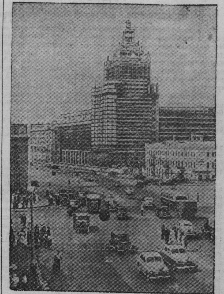
Строительство многоэтажного здания в Москве, на Большой Садовой улице, у площади Маяковского. Автор проекта — лауреат Сталинской премии архитектор Д. Н. Чечулин. (Фотохроника ТАСС).