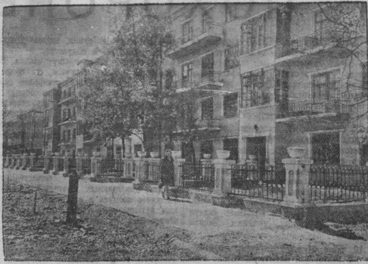
По городам Кузбасса. Гор. Ленинск-Кузнецкий, улица Энгельса.

«Я ощущаю неизмеримое чувство радости. Меня и моих подружек давно влекло в Кузбасс. И сейчас наша мечта сбылась. Мы вольемся в трудовую семью Кузбасса, мы будем воспитывать детей шахтеров и металлургов в духе глубокой преданности