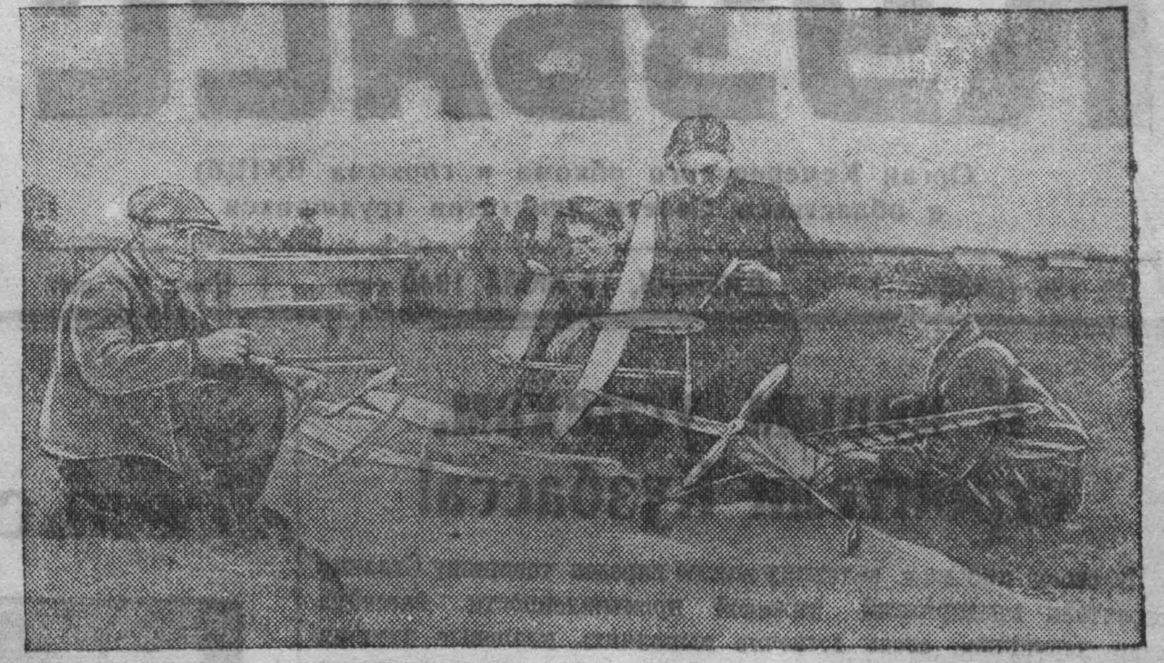
Группа юных авиамоделистов — участников областных состязаний.