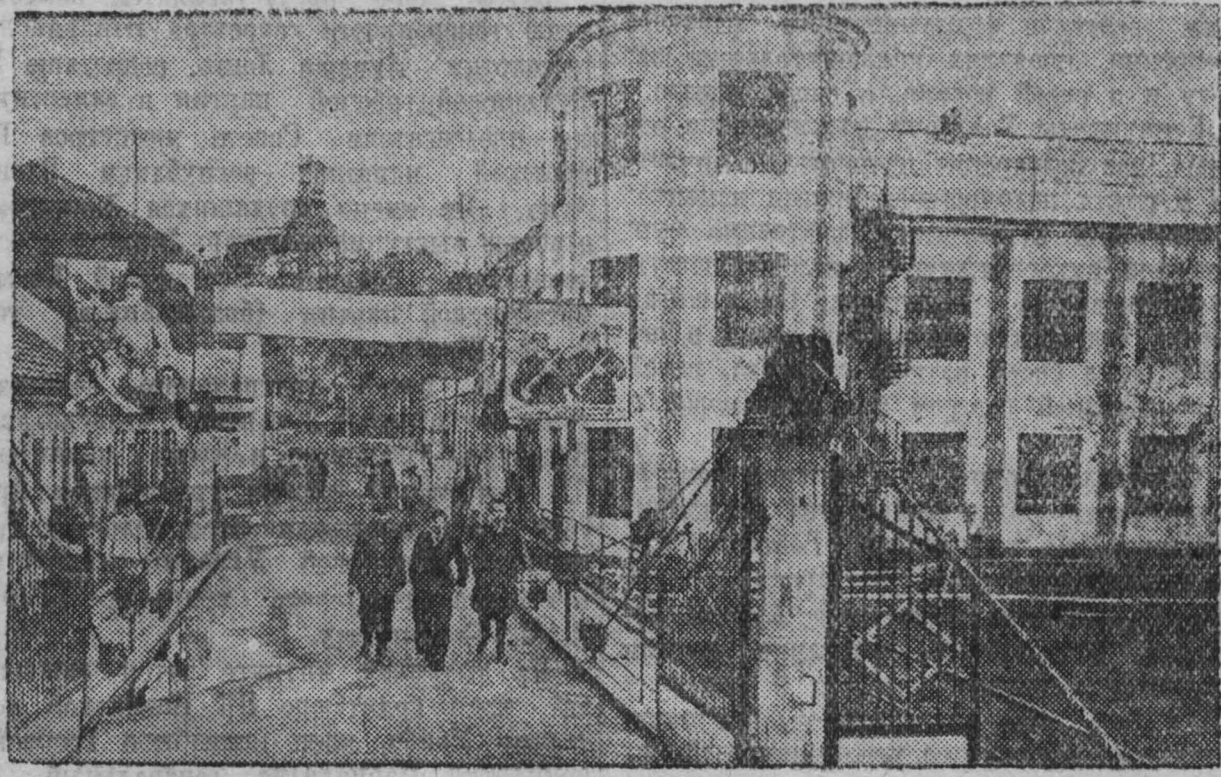
Общий вид шахты «Черная гора».