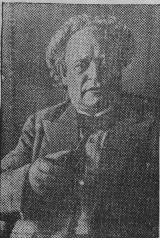
Сегодня исполняется 80 лет со дня рождения датского писателя Мартина Андерсена Нексе. На снимке: М. А. Нексе.