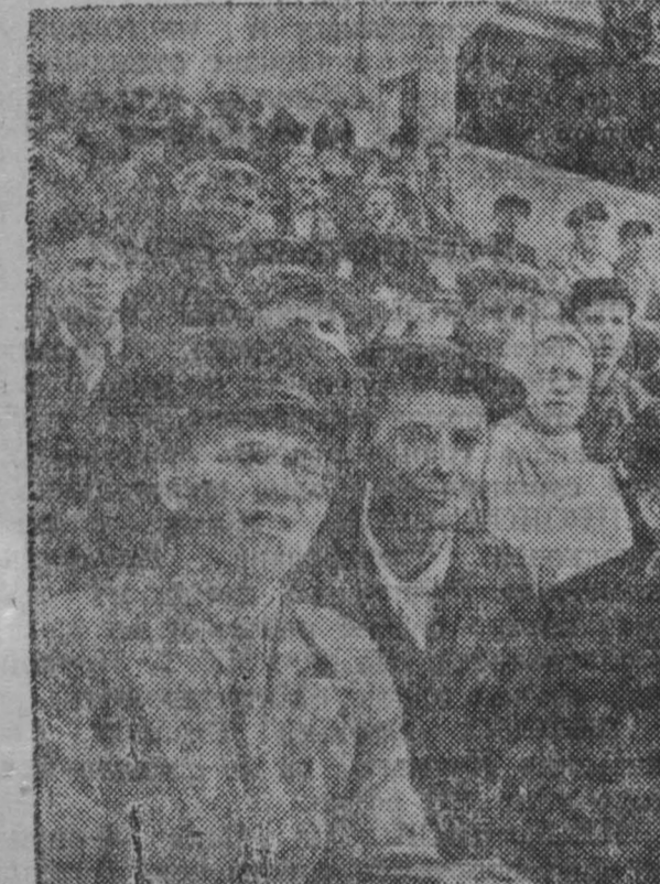
На стадионе «Шахтер» (Кемерово).

Комплекс ГТО — основа физкультурного движения. Но подготовка значков ГТО по городу идет крайне неудовлетворительно. За пять месяцев этого года подготовлено значков ГТО выполнено только на 9 процентов. Многим физкультурникам, чтобы получить значок ГТО, ослось сдать только нормы по плаванию. Между тем, этот вид спорта не пользуется достаточным вниманием ни у руководителей физкультурных организаций, ни руководителей городского и районного комитетов Советов депутатов трудящихся. В городе нет ни одной водной станции, и для этого гребли. Спортивное общество «Динамо» решило к 15 июня построить водную станцию, но прекрасная инициатива осталась пока на бумаге. Водная станция крайне необходима трудящимся города, и она должна быть построена 10—15 июля.