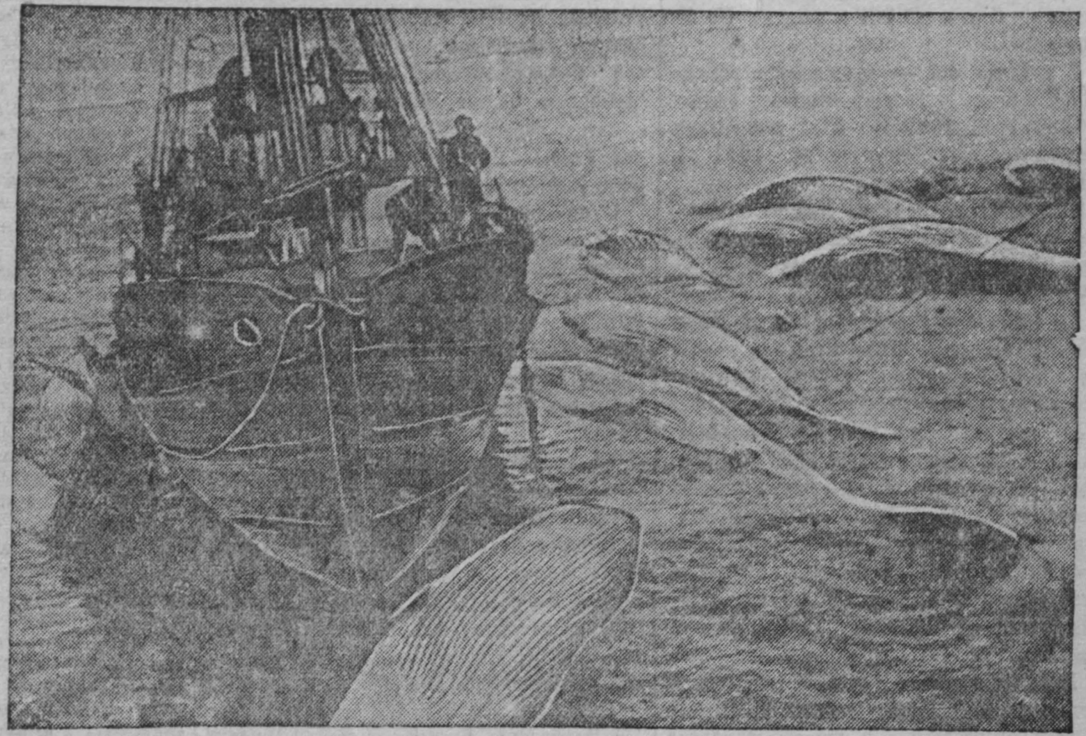
Советская китобойная флотилия «Слава» завершила свою третью антарктическую экспедицию. Преодолевая суровые условия — частые штормы, снежные бури, — экипажи судов перевыполнили задание по добыче китов, выработке медицинского жира и других продуктов. На снимке: китобоец «Слава» доставил к базе добытых китов.