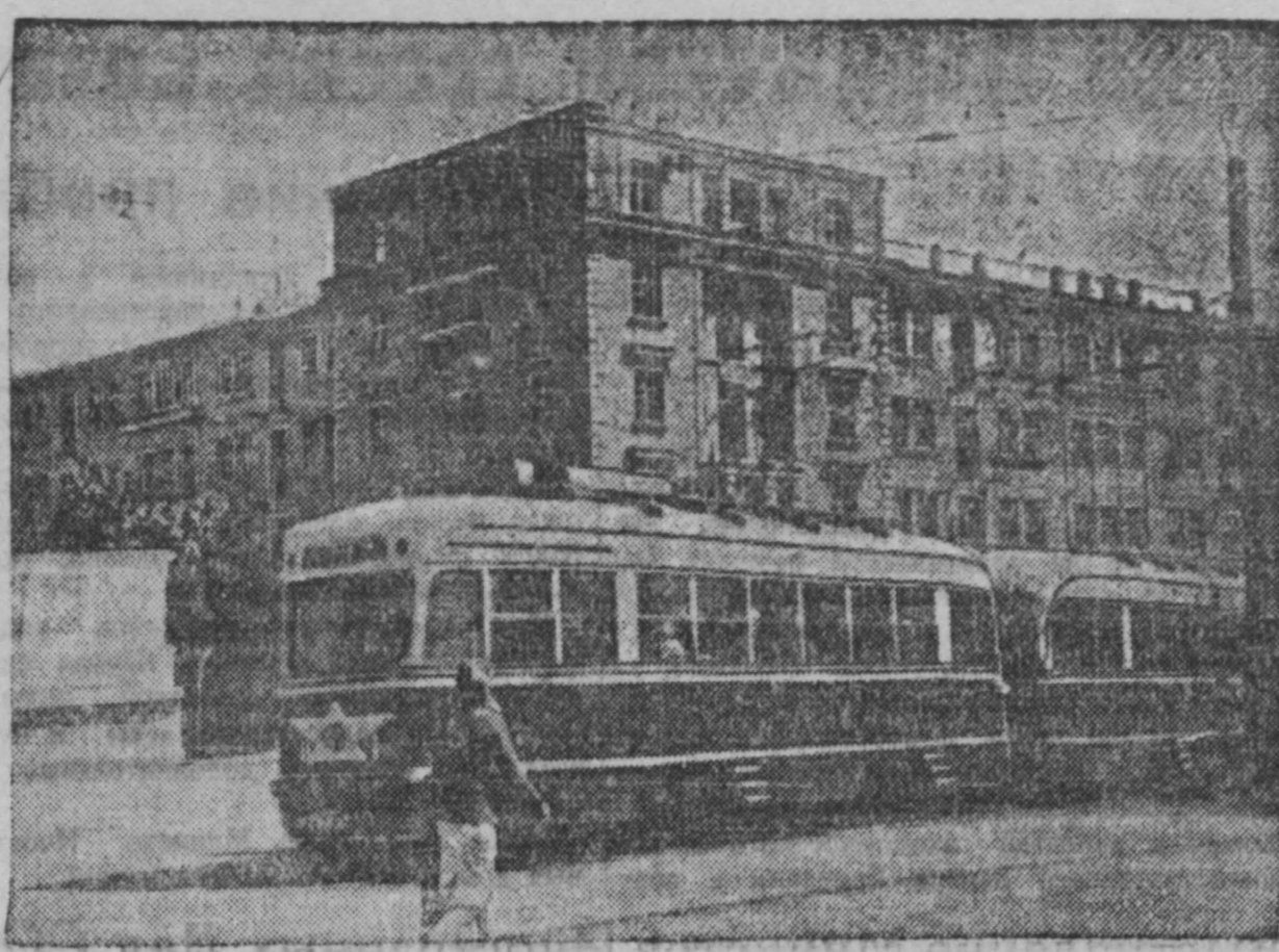
В центре города Кемерово на углу улиц Советская и Кирова сооружено пятиэтажное здание, заканчиваемое отделкой. Это — новый жилой дом, отстраиваемый для рабочих Новокирбината.