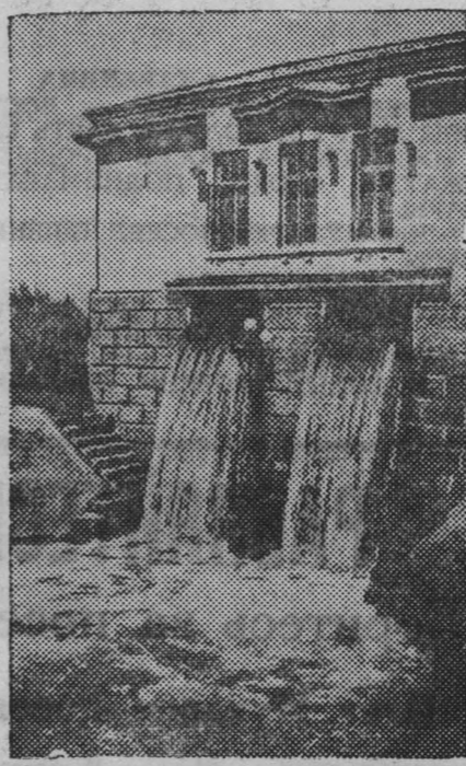
Узбекская ЦСР. Гидроэлектростанция колхоза «Юлярная звезда» Средне-Чирчикского района. Этот колхоз имеет 1.000 осветительных точек. (Фотокорресп. ТАСС).