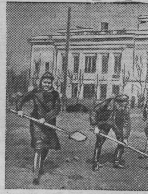
Гор. Кемерово. На воскреснике по благоустройству города.

Цалларис отметил, что греческое правительство, кроме того, рассматривает вопрос об установлении дружественных отношений с Италией.