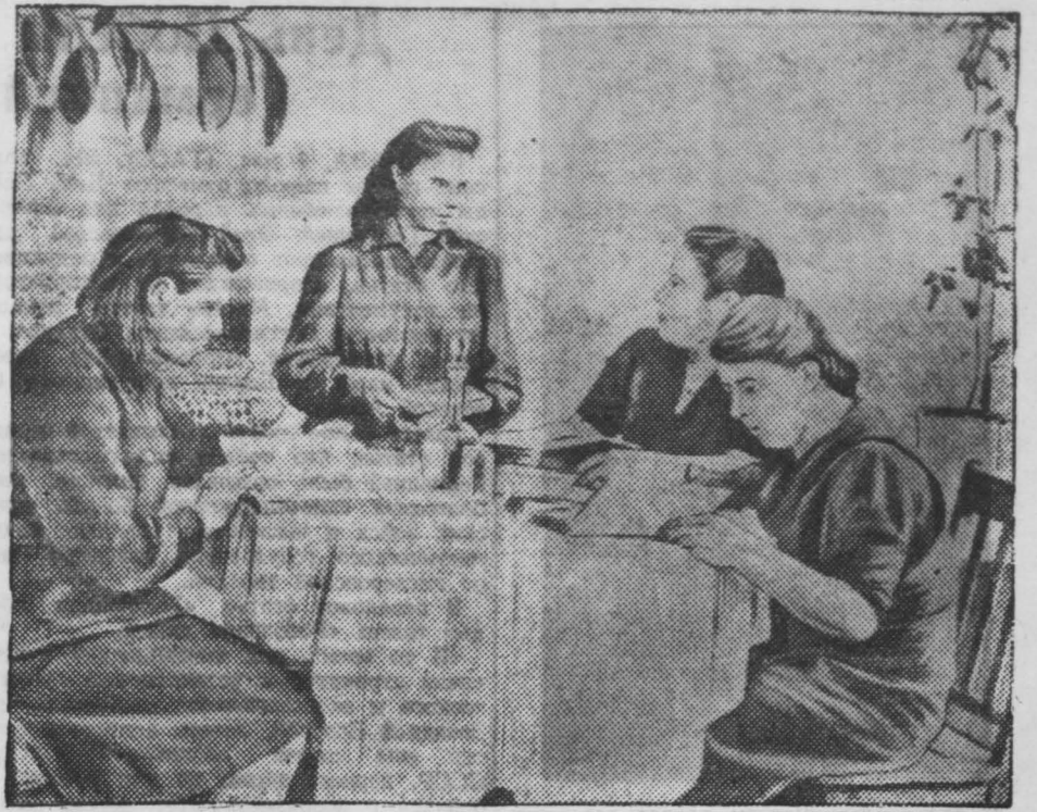
Молодежное общежитие № 33 шахты «Центральная» — одно из лучших в системе треста «Кемеровоуголь». Здесь, молодым горнякам созданы все условия, необходимые для здорового отдыха и плодотворных занятий. На снимке: девушки-горнячки, проживающие в общежитии № 33, за изучением «Краткого курса истории ВКП(б)».