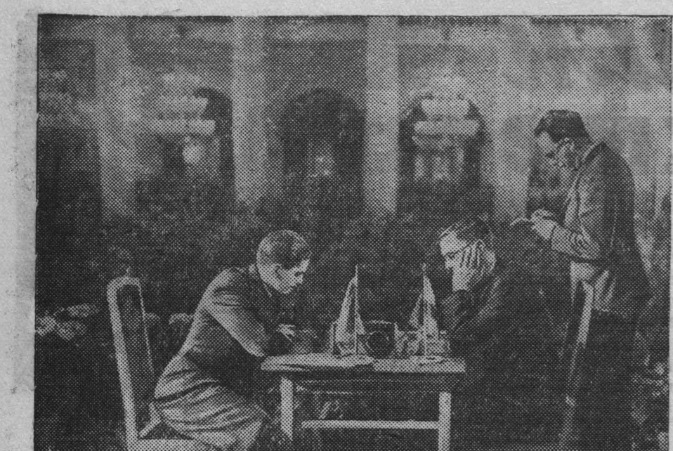
11-го апреля в Колонном зале Дома союзов начался первый тур третьего круга матч-турнира на первенство мира по шахматам. На снимке: гроссмейстер СССР П. Керес (слева) и экс-чемпион мира М. Эйве (Голландия).

Эти аппараты производят магнитную звукозапись на тончайшую металлическую пленку. С помощью «магнитофона» достигается необычайная чистота звукозаписи. Техника звукозаписи значительно упрощается.