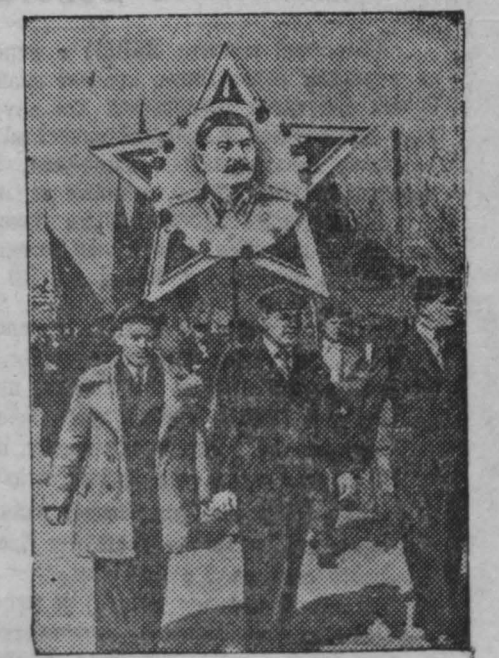
На первомайской демонстрации в г. Кемерово.