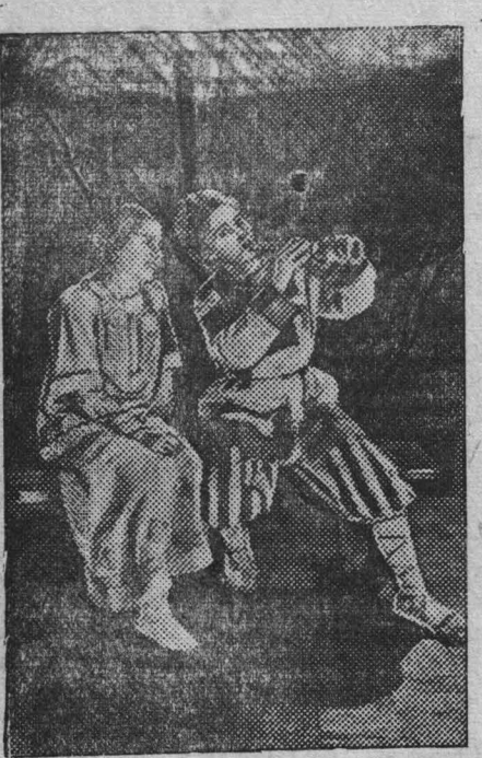
Саратов. В консерватории имени Собина обучаются свыше 150 человек. Недавно в консерватории состоялся смотр успеваемости студентов.

В новом клубе коксохимического завода состоялся три вечера. Особенно весело прошел молодежный вечер 30 апреля.