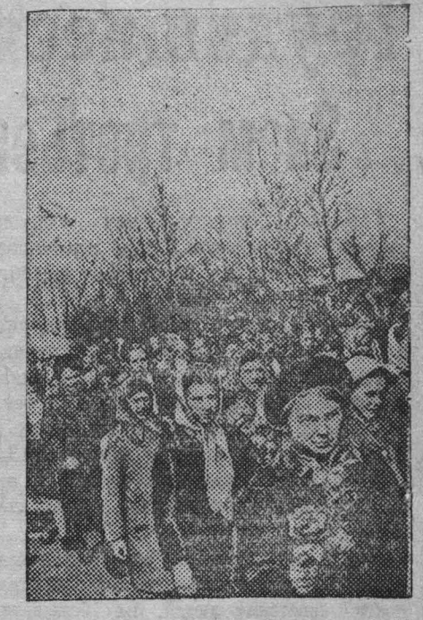
На первомайской демонстрации в г. Кемерово.

Об этом возмущительном факте Советскому Правительству стало известно лишь через 10 дней, т. е. с 10 по 21 апреля связь советской миссии с Министерством Иностранных дел СССР была прервана колумбийской стороной.