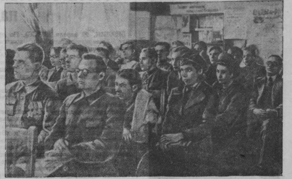
На конференции начинающих писателей Кузбасса.