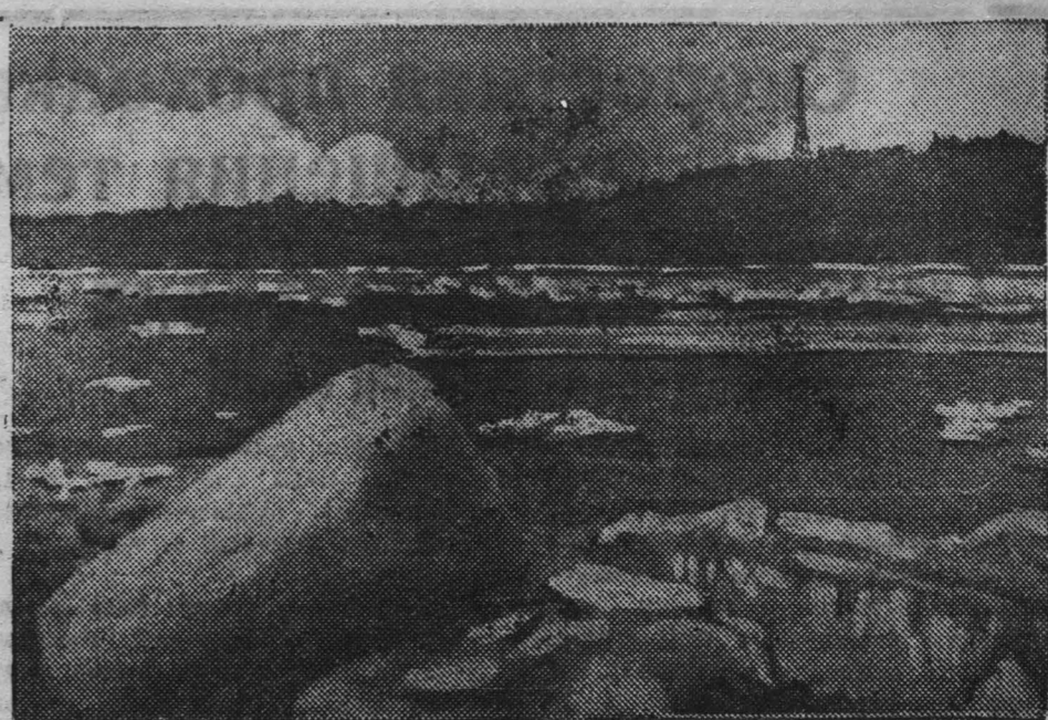
Ледоход на р. Томь у г. Кемерово.

Уничтожено 14 гоминдановских грузовиков, 4 броневика, 6 танков, 3 бронепоезда и 1 паровоз.