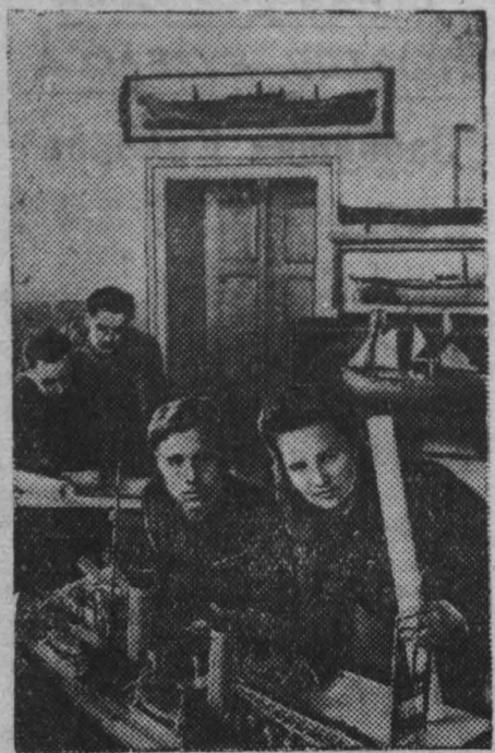
Одесса. Институт инженеров морского флота существует 25 лет. 18 студентов кораблестроительного факультета заняты сейчас дипломным проектированием. Через три месяца новый отряд специалистов приступит к самостоятельной работе на предприятиях судостроительной промышленности.

НАНКИН, 1 апреля. (ТАСС). Как сообщают нанкинское радио, согласно на авторитетные круги из Сеула, численность американских войск в Южной Корее увеличилась на 50 процентов.