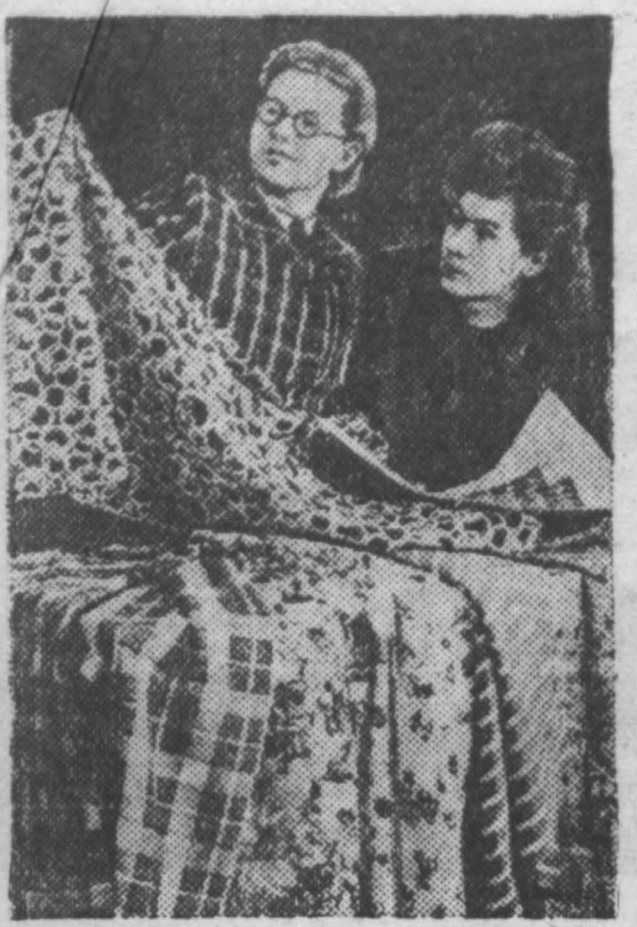
Московский шелкоткацкий и красильно-отделочный комбинат имени Шербакова в феврале изготовил сверх плана 100 тысяч метров тканей.

К весенне-летнему сезону комбинат выпускает шелковые ткани до 200 новых рисунков и расцветок.