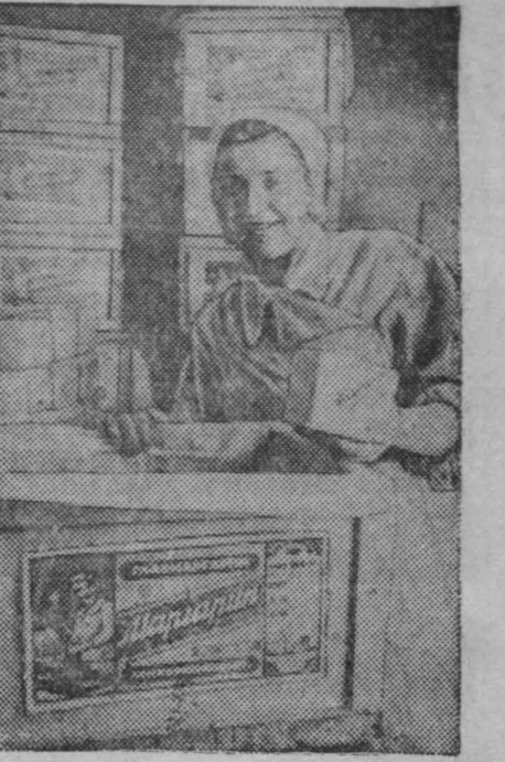
Ленинград. Коллектив Ленинградского жиркомбината досрочно выполнил годовую программу. Он выдал сверх годового плана свыше пяти тысяч тонн маргарина и сотни тонн растительного масла. В декабре выпуск продукции превысил доведенную выработку на 20 процентов.

БЕЛГРАД, 4 января. (ТАСС). Радио-станция Свободной Греции передала вчерашнее сообщение агентства «Электра» из Ледяки, в котором говорится, что в области Румелии части, подчиненные штабу Фиолетовых, совершили нападение на противника на высотах Ано Палиоскорпио, у долины Дориды. После тяжелого трехчасового боя противник был разбит и в панике бежал, оставив на поле боя 7 убитых и много раненых. Захвачено автоматическое оружие, много винтовок английского происхождения, патроны, гранаты и другие военные материалы.