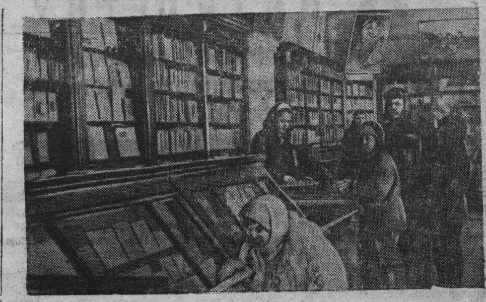
Оживленно идет торговля книгами и пишесуажными принадлежностями в новом магазине КОИЗ'а в Кемерово. Магазин хорошо оборудован, большие застекленные витрины знакомят покупателя с книжными новинками. На снимке: общий вид книжного магазина.

Да здравствует нерушимая дружба между советским и венгерским народами, между Советским Союзом и Венгерской республикой! (Бурные аплодисменты, возгласы одобрения). Да здравствует Маршал Ворошилов! Да здравствует советско-венгерская дружба!