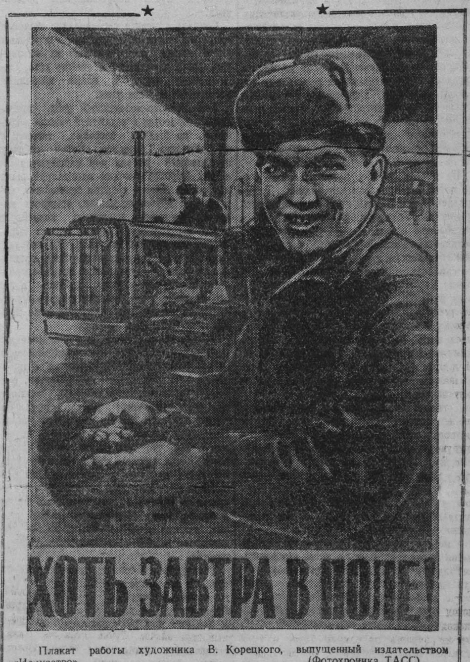
Плакат работы художника В. Корещко, выпущенный издательством «Искусство» (Фотохроника ТАСС)

Конкретное руководство соревнованием осуществляет заместитель директора по политчасти тов. Бардиан.