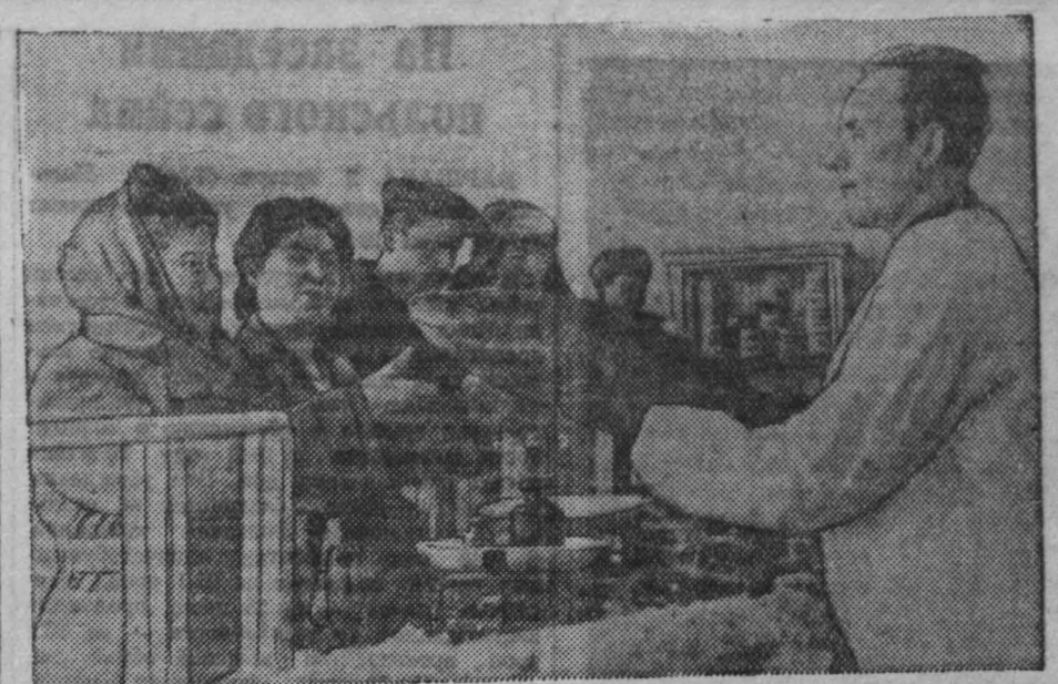
В ОРС'е треста «Кемеровоуголь» на днях открылся магазин пролажи мяса и рыбы. В магазине имеется в большом ассортименте мясо, свежемороженая рыба, консервы и колбасные изделия. На снимке: в мясо-рыбном магазине ОРС'а треста «Кемеровоуголь».

Инженер Балабанов в своем докладе поднял очень важный вопрос о комплексной механизации при подготовке выемочных участков крупнообломочных пластов. Докладчик разработал пути комплексной механизации ближайшего периода, наметил механизмы, с помощью которых в ближайшие годы преобразуется выемочный участок в угольную промышленность.