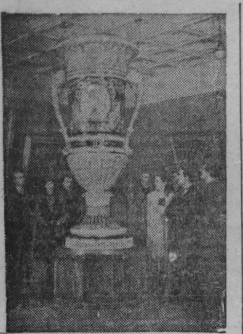
Рабочие, инженеры, техника и служащие Дзержинского фарфорового завода, существующего уже около 200 лет, прислали в подарок товарищу Сталину художественно исполненную, монументальную вазу.

Юбилейная ваза, изготовленная коллективом завода, представляет собой поистине уникальное художественное произведение. Огромная, высотой в 2,5 метра, ваза сделана из белого фарфора, декорированного золотом и кобальтом. По бокам ее выгравированы слова: «30 лет Великой Октябрьской социалистической революции». Большие портреты В. И. Ленина и И. В. Сталина обрамлены орнаментом из листьев дуба и лавра. На вазе выгравированы золотом гербы 16 союзных республик. По распоряжению товарища Сталина юбилейная ваза передана в Третьяковскую галерею.