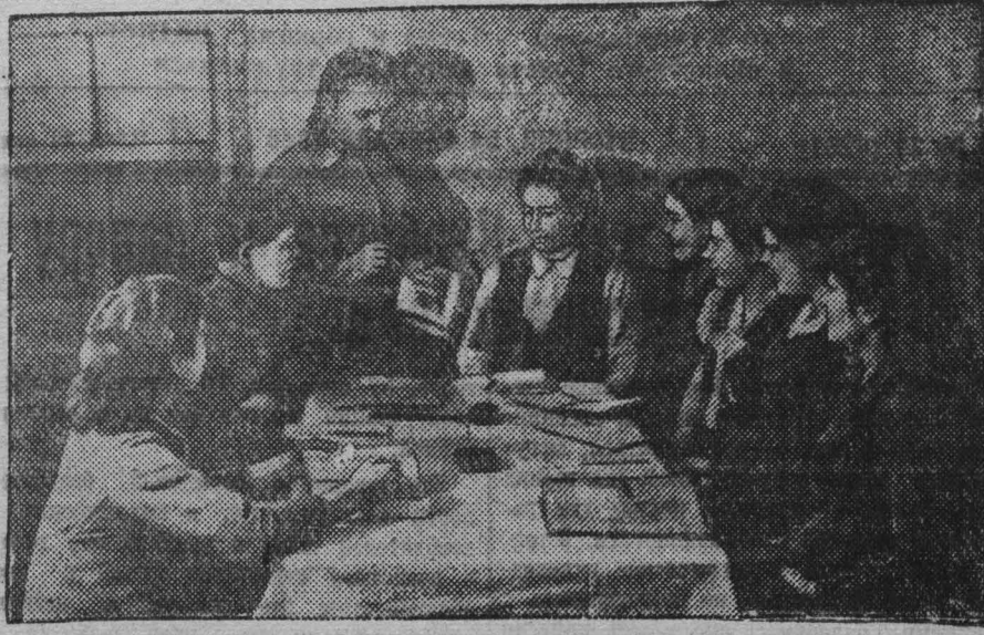
В анжерском совхозе ОРСа треста «Анжероуголь» хорошо организована знающая агротехническая учеба.

руководитель агротехнической школы, агроном колхоза «Искра», Ленинско-Кузнецкого района.