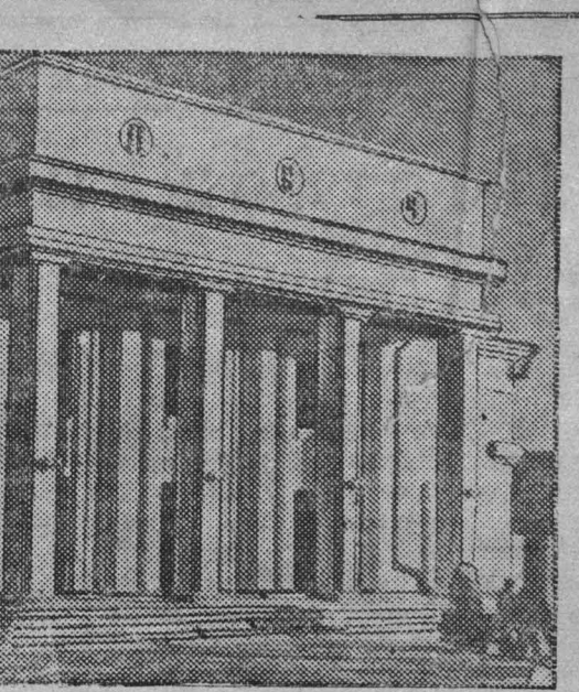
В Юрге в начале этого года открылся новый кинотеатр «Луж». На снимке: главный вход кинотеатра.

Для работы на Крайнем Севере требуются: горные инженеры и техники всех специальностей и геологи, инженеры — геодезисты и топографы, инженеры и техники — химики и металлурги, инженеры-механики по авторотационному делу, экскаваторам, горному оборудованию и технологии, инженеры — теплотехники и дизелисты, инженеры — строители и автодорожники, техники связи и телеграфисты.