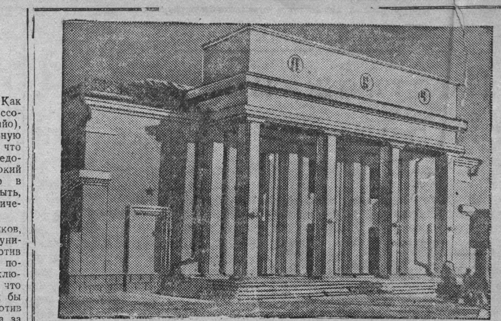
В Юрге в начале этого года открылся новый кинотеатр «Луж». На снимке: главный вход кинотеатра.

Для работы на Крайнем Севере требуются: горные инженеры и техники всех специальностей и геологи, инженеры — геодезисты и топографы, инженеры и техники — химики и металлурги, инженеры-механики по авторотационному делу, экскаваторам, горному оборудованию и технологии, инженеры — теплотехники и дизелисты, инженеры — строители и автодорожники, техники связи и телеграфисты.