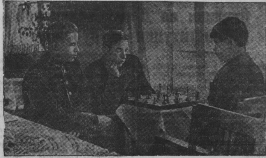
В часы досуга в красном уголке общежития № 26 шахты № 4 треста «Молотовуголь».