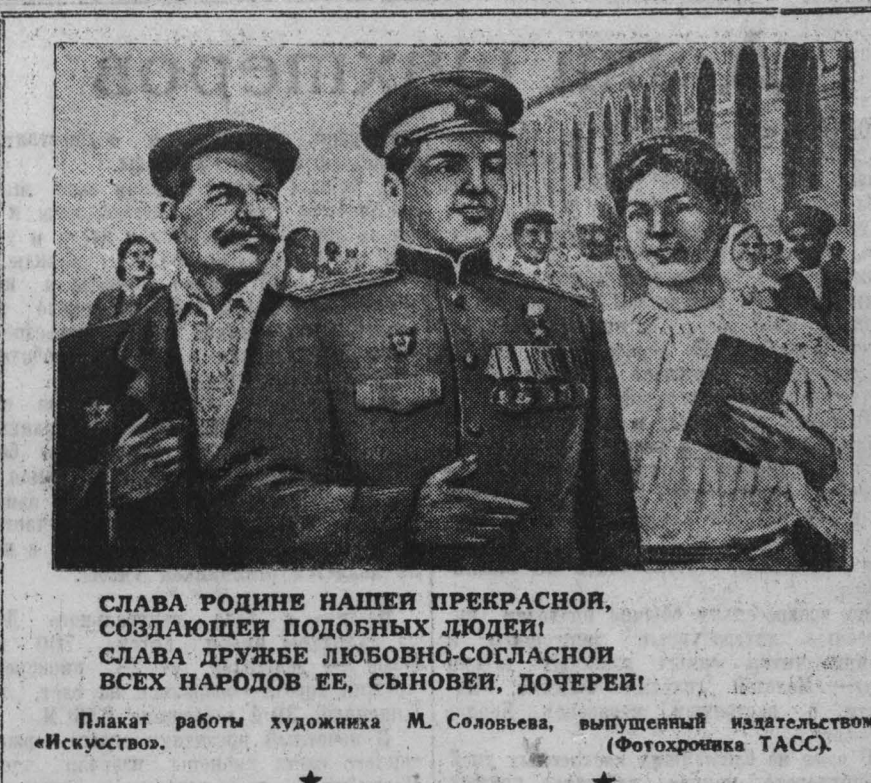
Плакат работы художника М. Соловьева, выпущенный издательством «Искусство».

НЬЮ-ЙОРК, 4 ноября. (ТАСС). Последние данные опубликованные агентством Ассошиэйтед Пресс относительно результатов выборов, свидетельствуют, что Трумэн получил почти на два миллиона больше голосов, чем Дьюи, и что Дьюи в этих выборах получил меньше голосов, чем в 1944 году, когда президентом был избран Рузвельт. В 10 часов по нью-Йоркскому времени, когда было подсчитано 44.603 тыс. голосов, агентством Ассошиэйтед Пресс сообщается, что Трумэн получил 22.288 тысяч голосов, Дьюи — 20.240 тысяч, Уоллес — 1.030 тысяч и Турмонд — 864 тысячи голосов. Агентство указывает, что больше всего голосов Уоллес получил, главным образом, в штатах, где имеется много промышленных рабочих, а именно: в штатах Нью-Йорк, Калифорния, Пенсильвания, Мичиган и др.