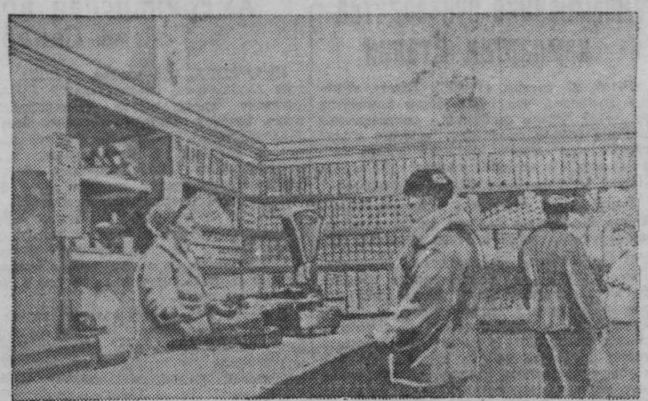
В магазине № 1 отдела рабочего снабжения треста «Кемеровоуголь» в Рудничном районе образцовый порядок и обилие товаров.