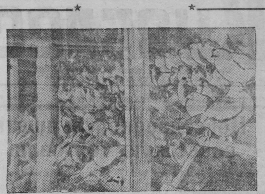
В Топкинском совхозе треста «Кемеровоуголь» успешно развивается птицеводство. Совхоз имеет свыше тысячи породистых кур. На снимке: птеник Топкинского совхоза.

агроном-инспектор, зам. государственного инспектора по определению урожайности Мариинского междурья.