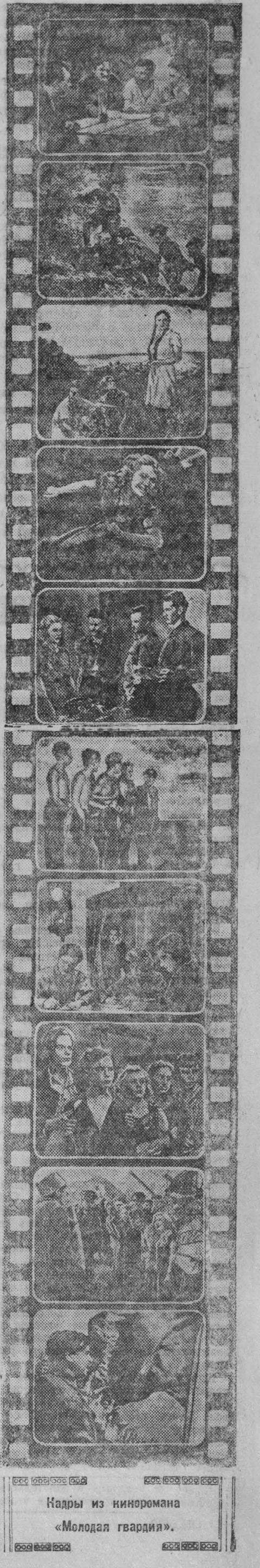
Кадры из киноромана «Молодая гвардия».

Мы подобрали Краснодон, его скромный, трогательный пейзаж, отлично описанный в романе Фадева. Весь наш коллектив стал патриотом этого маленького городка, давнего советскому народу явлению юных героев.