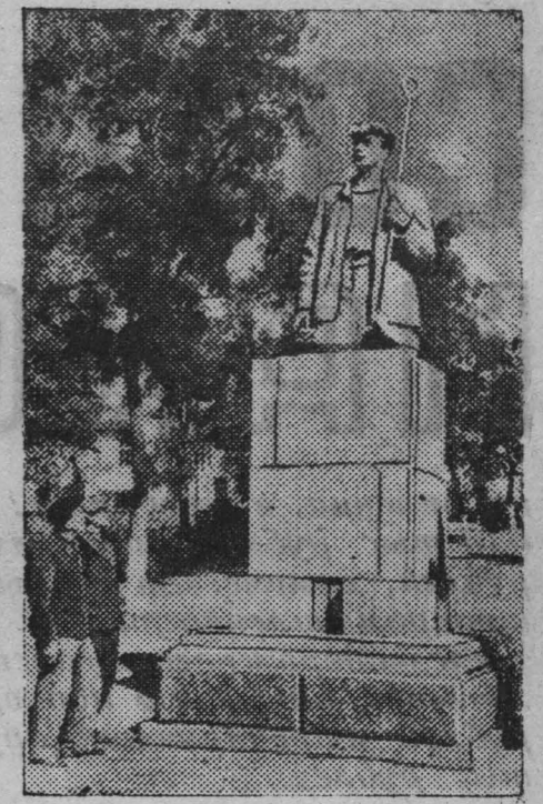
Мариуполь. В день пятой годовщины освобождения города здесь открыт памятник знатому сталелитейщику страны Макару Мазаю, работавшему на Мариупольском заводе имени Ильича, зверски замученному немецко-фашистскими оккупантами. Памятник установлен недалеко от завода. На снимке: памятник Макару Мазаю.

В Большом зале демонстрируются фильмы: 11-17 октября — «МОЛОДАЯ ГВАРДИЯ», 1-я серия. 18-24 октября — «МОЛОДАЯ ГВАРДИЯ», 2-я серия. 25-го — «КАК ЗАКАЛЯЛАСЬ СТАЛЬ». 26-го — «КОМСОМОЛЬСК». 27-28-го — «МАЛЬЧИК С ОКРАИН». 29-го — «РЯДОВОЙ АЛЕКСАНДР МАТРОСОВ». 30-го — «ЗОЯ». 31-го — «МОЛОДОСТЬ НАШЕЙ СТРАНЫ». 1 ноября — «ДЕНЬ ПОБЕДИВШЕЙ СТРАНЫ». Малый зал — с 11 октября — «ПАРЕНЬ ИЗ НАШЕГО ГОРОДА». Сessия: 6, 7-40, 9-20 и 11.