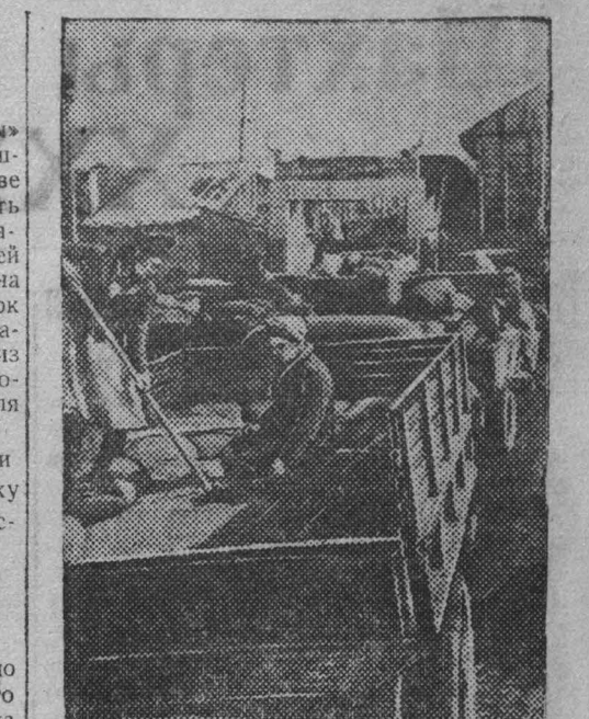
Кузнецкий район занимает первое место по хлебоблагодатности. Хлеб богатого урожая, выращенного потоком идет в государственные закрома.

Ход голосования на вчерашнем заседании привлек обескураживающее впечатление даже на многих представителей государств.