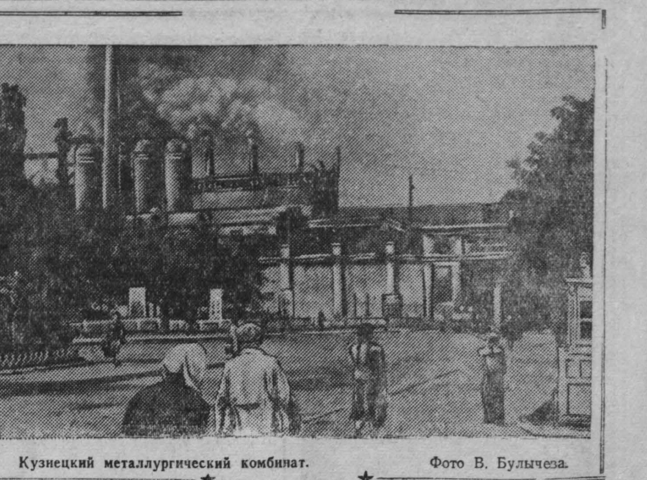
Кузнецкий металлургический комбинат.